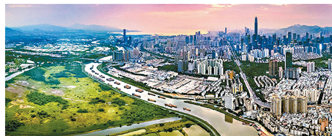
●河套深圳園區吸引了許多科研機構進駐。

先在進銷存系統上進行貨物預登記，完成信息填報後，再按海關監管要求在電子口岸二期棧塊和單一窗口棧塊完成單證申報。之後，科研人員即可攜帶科研貨物通過備案小汽車或河套跨境巴士到達一號通道旅檢廳進行貨物與人員信息核對，查驗完成後便可進入合作區內。