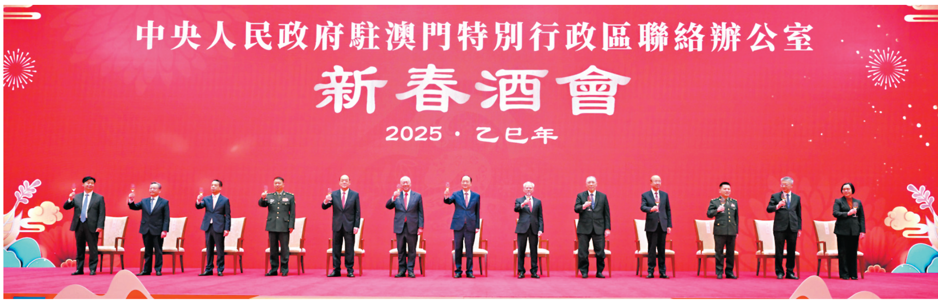
中央人民政府駐澳門聯絡辦公室昨日舉辦新春酒會，賓主祝酒。