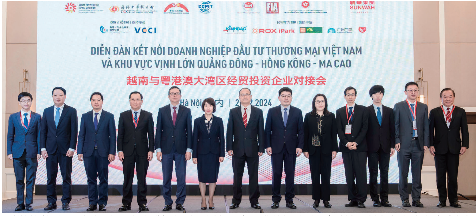
▲越南計劃與投資部副部長阮氏碧玉（左六）、外交部副部長范青平（左五）、老街省人民委員會副主席黃國慶（左四）受邀出席粵港澳大灣區企業家聯盟舉辦的兩地經貿投資企業對接會。

越南計劃投資部部長阮志勇會見由中國全國政協常委蔡冠深率領的粵港澳大灣區企業家代表團時透露，越南已確立未來十年高速發展目標，全力建設一系列關鍵項目，包括南北高速鐵路、河內和胡志明市內輕軌、打造胡志明市成為區域金融中心等等。期望更多以粵港澳大灣區為代表的中國企業積極參與越南基建、金融、綠色生產、高新科技等行業投資。