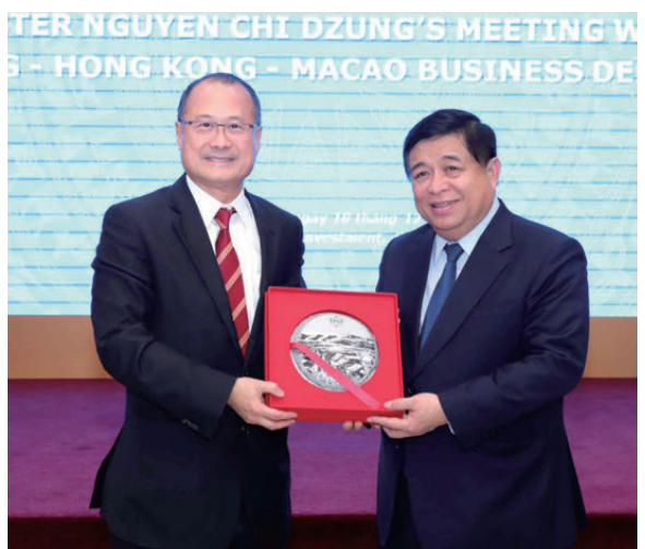
▲蔡冠深與越南計劃投資部部長阮志勇會面。