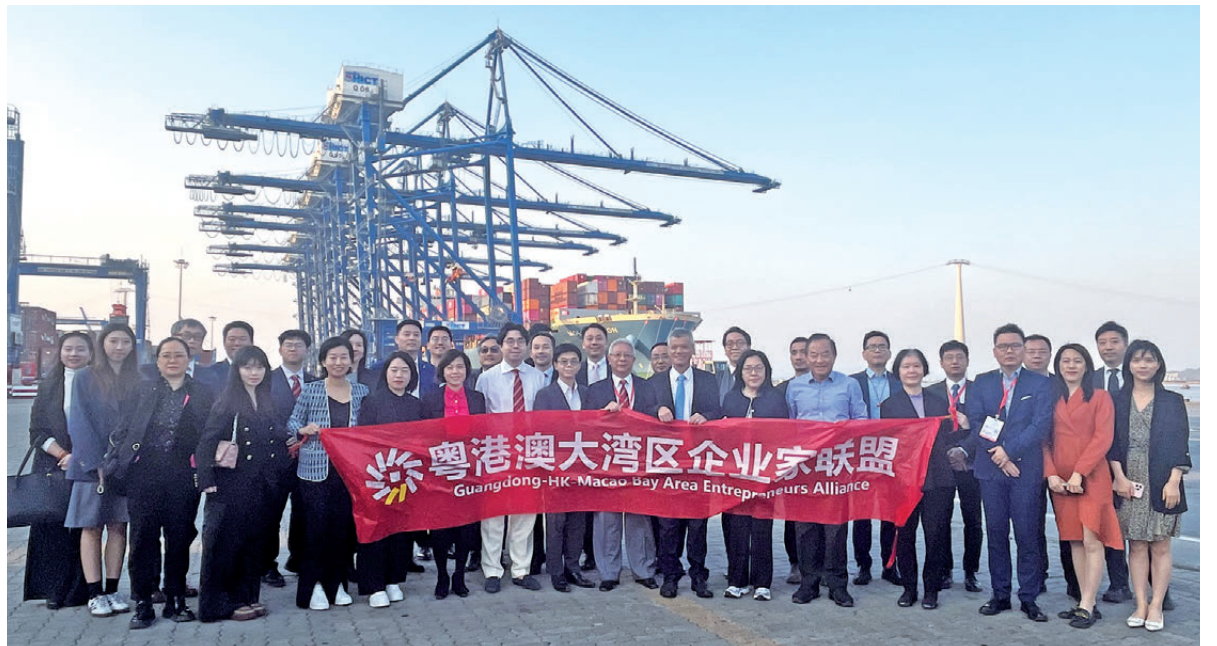
▲代表團到越南海防考察。