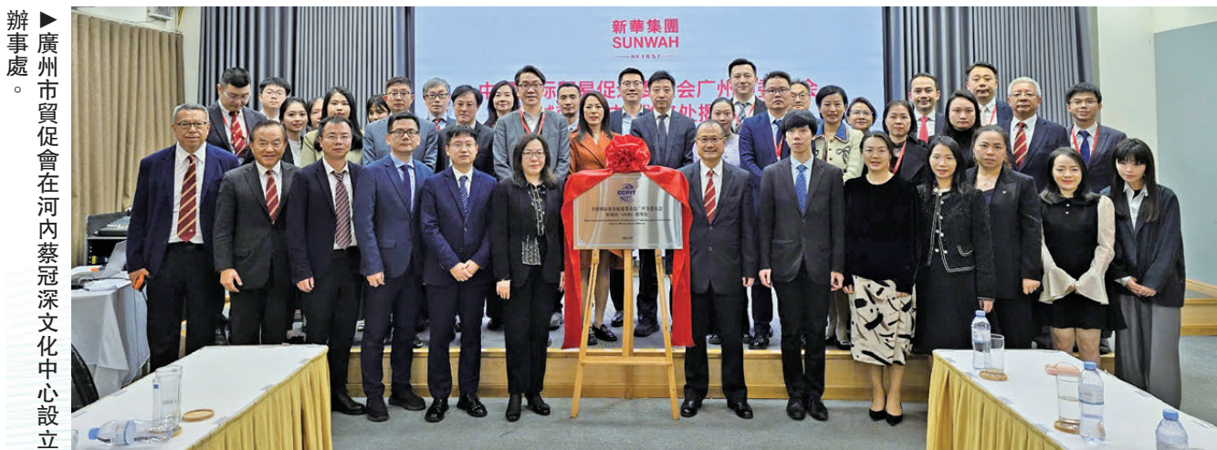
辦事處。廣州市貿促會在河內蔡冠深文化中心設立