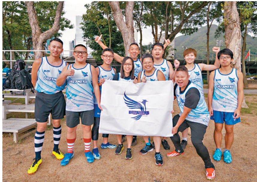
●「Dreamers」組隊背後的理念——以球會友。

香港文匯報訊(記者 葉詩敏)香港國際七人欖球賽舉行在即，這個本地年度盛事每每掀起欖球熱潮。去年夏天，一班欖球「素人」透過「賽馬會好動城市計劃」的非撞式欖球班，發掘運動的樂趣。非撞式欖球不像7人和15人欖球般有猛烈的衝撞和擒抱，是少數可供男女混合隊伍互相競爭的團體運動之一。