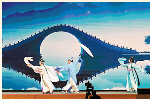
粵劇《白蛇傳·情》。

香港文匯報訊（記者 黃子晉、康敬、蔡學怡）即將到來的新春佳節，是聯合國教科文組織將春節列入人類非物質文化遺產代表作名錄後的第一個春節。昨晚舉行的中央政府駐港聯絡辦2025年新春招待會上安排了頗具中國傳統文化特色的舞龍舞獅、中樂、琵琶和粵劇，以及合唱愛國主義教育歌曲等表演，這些既彰顯中國傳統文化風采，又充滿愛國主義情懷的節目，獲得陣陣掌聲與喝彩。