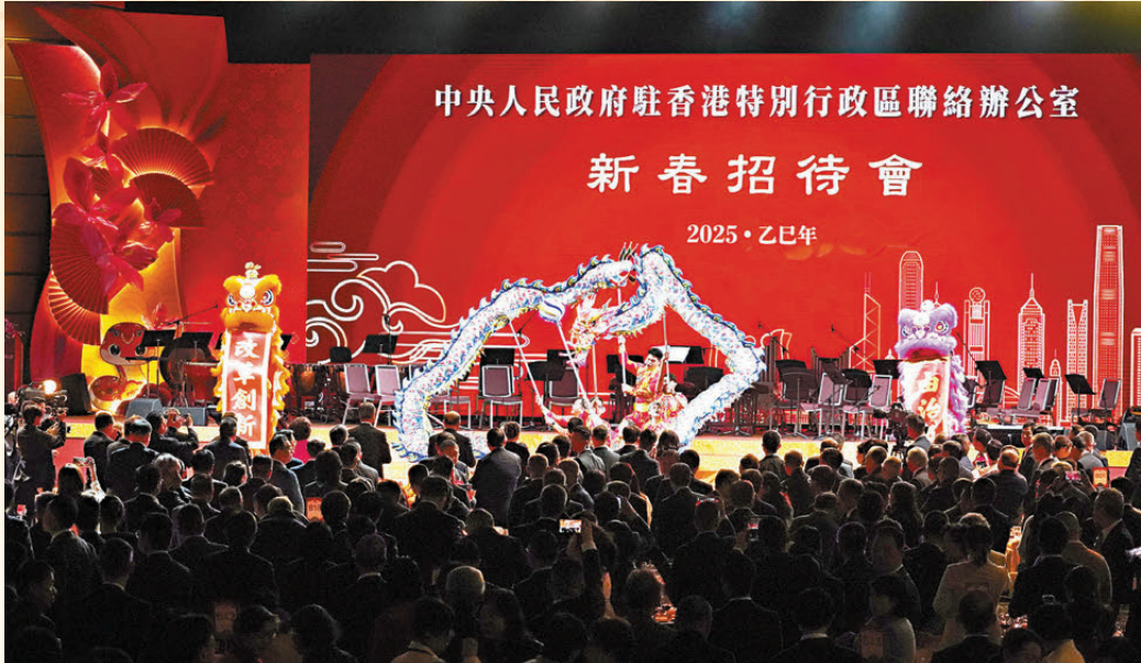
具中國傳統文化特色的舞龍舞獅。