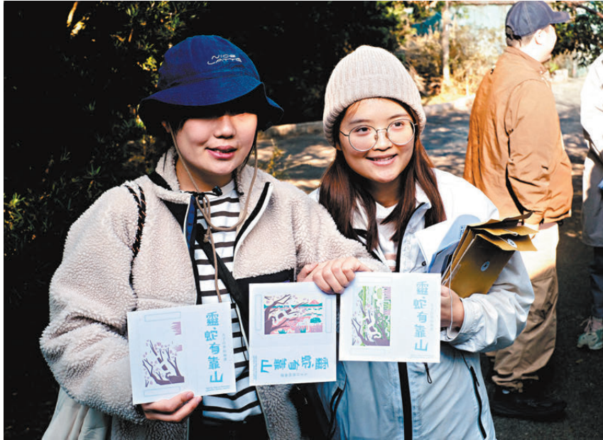
●遊人可在園內設置的六個印章站，收集不同顏色的印泥。

他坦言，城市發展不斷侵佔蛇類棲息地，也可能引發更多「人蛇交鋒」情況，而全球暖化下香港冬季變得暖和，也令蛇在冬季出沒時間因而更長。