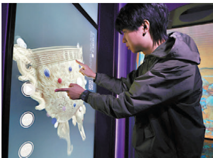
▲以數位影像方式呈現故宮博物院的珍藏文物，當中22件展品可觸摸賞玩。