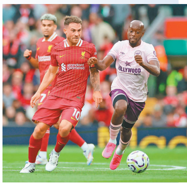
●利物浦（左）首循環以兩球淨勝賓福特。

同日大戰還有阿仙奴主場對阿士東維拉（Now611及621台周日1:30a.m.直播）。阿仙奴在上場「北倫敦打吡」反勝熱刺，一洗3場不勝頹風，球隊是役續有主場之利有力爭勝。維拉近3場比賽對李斯特城、韋斯咸和愛華頓取得全勝，近況和士氣不俗。陣容上，剛從多蒙特加盟的荷蘭國腳當耶爾馬倫，預計有望先列後備，