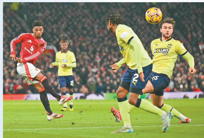
●阿密特（左）已成為曼聯新核心。