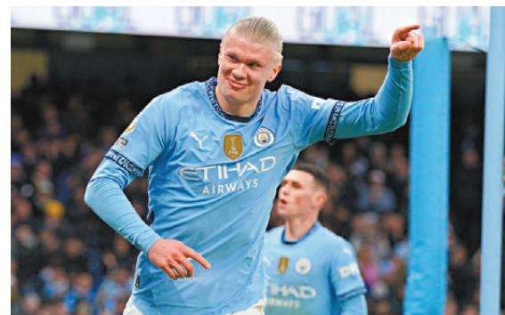
●夏蘭特續下超級長約。

香港文匯報訊 英超豪门曼城昨日官方宣布，與陣中24歲挪威前鋒艾寧夏蘭特完成續約，新約長達9年半至2034年夏天。消息指，夏蘭特新約周薪將提升至50萬英鎊，將為英超最高薪球員。夏蘭特在官網表示，期待能在曼城度過更多美好時光。