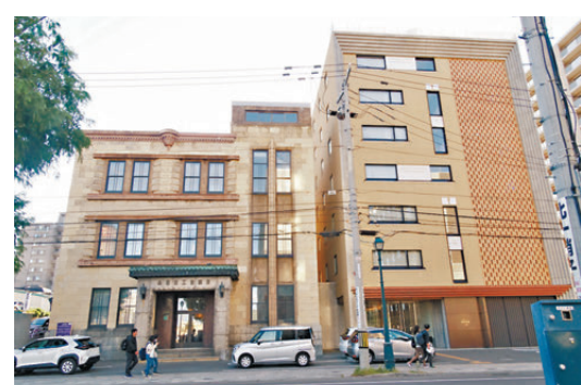
●由歷史建築活化成酒店，名為OMO5小樽，左為南館右為北館。