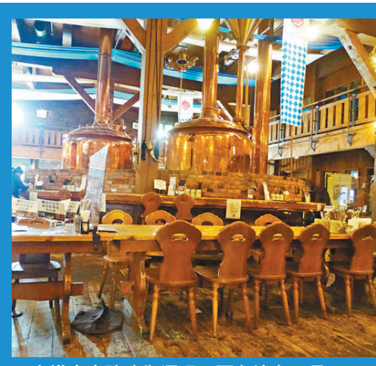
●小樽倉庫改建為酒吧，可在這兒一品小樽啤酒。