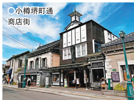
●小樽堺町通商店街