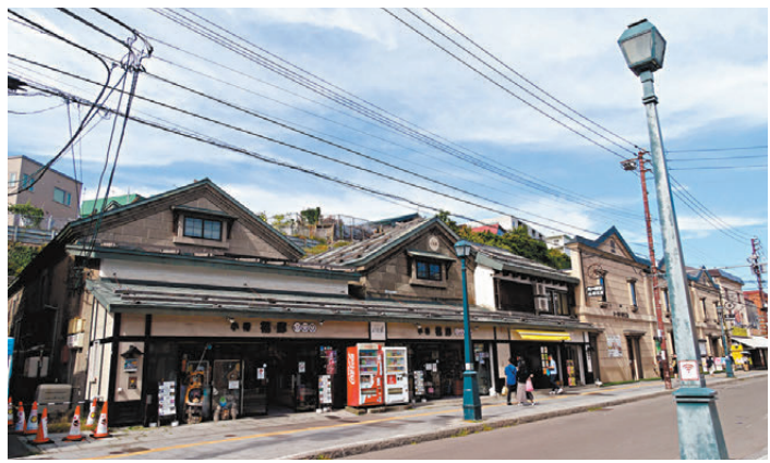
●小樽堺町通商店街充滿懷舊氣息