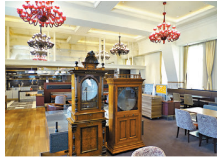
●OMO Cafe & Bar中間置着歐洲運來十九世紀的坐地音樂櫃。

酒店還提供自助早餐，分為日式及西班牙兩種風味：日式早餐採用當地南樽市場的熱食小菜，包括鯖魚、南蠻雞、煮物等，當中較為吸睛的是海鮮散壽司杯，搭配三文魚、三文魚、秋葵及雞蛋絲等。西班牙料理方面則有番茄生火腿烤麵包，更有即叫即炸Churros，沾上濃郁朱古力醬相當可口。另外，最有特色的是南館3樓的OMO Cafe & Bar，中間置着歐洲運來十九世紀的坐地音樂櫃，晚間更會變成以煤油燈照亮的酒吧，提供各種當地的雞尾酒、紅酒、威士忌等，更有佐酒小食，睡前小酌一杯再適合不過！