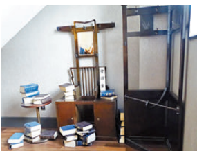
●南館大樓保留了原有工會議所的古董傢具。

距離JR小樽站步行10分鐘，前往小樽運河步行3分鐘的OMO5小樽，南館以小樽市指定的歷史建築翻新而成，是一處可以感受時光流逝、沉浸懷舊氣氛的空間，在擁有開窗高窗和寬敞空間的客房內，感受復古風情。OMO5小樽定位為精品飯店，提供餐廳、酒店早餐、周邊活動等服務。於2022年開幕，分為南北兩棟，其中南館由有90多年歷史的「舊小樽商工會議所」改建而成，充滿昭和復古風；而北館則走現代摩登風。一進入大堂就可以見到標誌性的「GO-KINJO MAP」，上面列有酒店附近美食、景點，全部都是員工極力推薦。