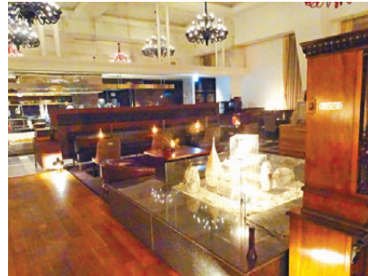
●晚間變成以煤油燈照亮的酒吧。