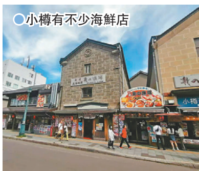
●小樽有不少海鮮店

走畢小樽運河後，就向堺町通走，堺町通相當好走，堺町通商店街是一條充滿懷舊氣息的商店街，兩旁林立着歷史悠久的石砌建築，提供新鮮的海鮮、甜點等各種當地美食。小樽的名物如北一硝子館、小樽オルゴール堂（音樂盒）等都雲集於此，同時也可以在這兒買到六花亭、北菓樓、LeTAO雙層芝士蛋糕等伴手禮。從迷人的咖啡館到獨特的紀念品商店，以及精美的手工藝品如玻璃製品等，都讓人沉浸在迷人氛圍中。