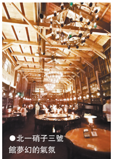
●北一硝子三號館夢幻的氣氛

這座「北一硝子三號館的北一廳」，本是舊木村倉庫，利用明治時期當地漁業倉庫改建，現今作為咖啡廳營運，北一廳內的照明，僅由167盞石油燈組成，始於距今100多年前的油燈不僅喚起了復古的回憶，更打造出夢幻的氣氛，可以說是北一硝子的象徵。店內被溫暖的燈光照射，打造出如同電影畫面般的夢幻空間，大家可以在店內悠閒享用甜點和咖啡，享受悠閒舒適的幸福時刻。