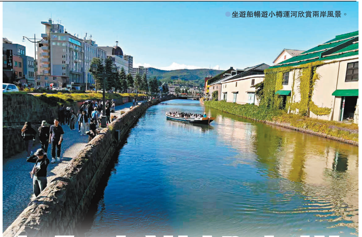
●坐遊船暢遊小樽運河欣賞兩岸風景。