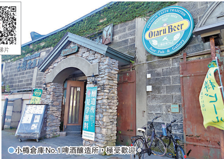
●小樽倉庫No.1啤酒釀造所，極受歡迎。

石頭倉庫和歷史建築鱗次櫛比，無論從哪裏切入，都是小樽風景如畫的觀光景點。沿着運河從一端慢慢走到另一端大約需要20分鐘，周圍有許多使用石頭倉庫和舊建築的咖啡館和餐廳，是散步時的好去處。黃昏時分，63盞瓦斯燈亮起，倉庫內燈火通明，營造出不同於白天的夢幻氣氛。