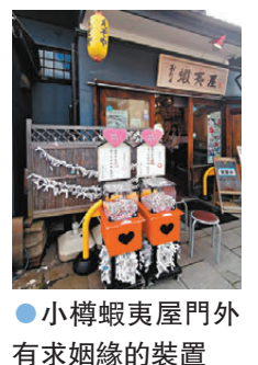
●小樽蝦夷屋門外有求姻緣的裝置