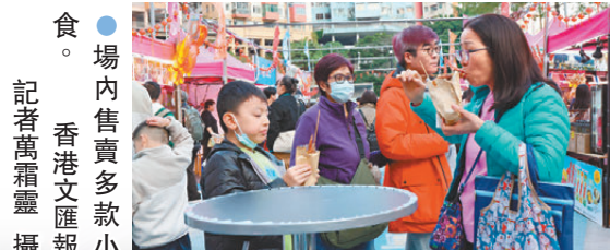
●場內售賣多款小吃。