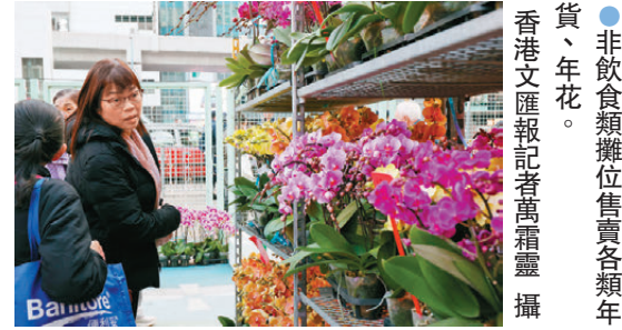
●非飲食類攤位售賣各類年貨、年花。

在市集的開幕典禮上，商務及經濟發展局局長丘應樺致辭時表示，是次活動可帶旺觀塘區商團人流，促進地區經濟，「新一年，我們將繼續致力推動地區經濟，祝願夜市商戶朋友生意興隆，到訪的街坊朋友開開心心辦年貨、享用美食，一同迎接蛇年。」他相信香港經濟在社會各界努力創造機遇、積極發揮創意下，必定會再次騰飛。