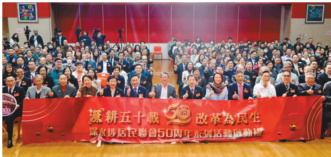
●陳茂波出席深水埗居民聯會50周年系列活動啟動禮。香港文匯報記者涂六攝