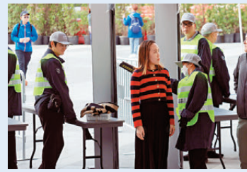
●入場人士經過安檢。