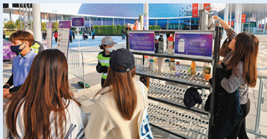
●觀眾不能帶水樽入場，場外有鐵架供水樽擺放。