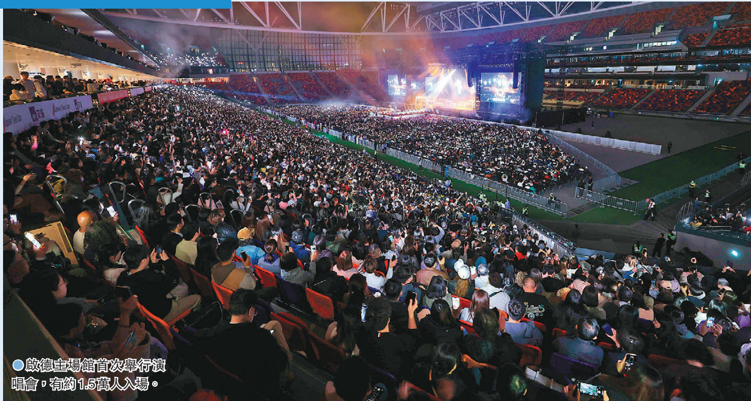
●啟德主場館首次舉行演唱會，有約1.5萬人入場。

表示，啟德主場館選址方便，輪椅位也比亞博館理想，「不會看不到舞台，起碼唔會被遮住。」