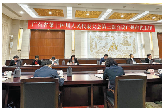
●廣東省十四屆人大三次會議期間，廣州代表團舉行全體會議並向媒體開放。

「價值鏈的創造遠不僅限於加工組裝，廣州和香港的合作應當擴展至更廣的層面，從『廣度』上延伸。」曲建認為，廣州作為華南地區最大的商貿中心，與香港在東南亞地區的國際商貿中心地位相得益彰。過去，香港和廣州的「合作多圍繞