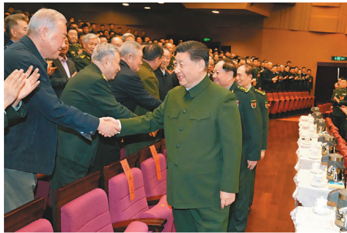
●1月17日下午，中央軍委慰問駐京部隊老幹部迎新春文藝演出在北京舉行。習近平觀看演出，向在座的軍隊老同志，向全軍離退休老幹部，致以節日問候和新春祝福。

張又俠、何衛東、劉振立、張升民一同觀看。觀看演出的還有軍委機關各部門、軍隊駐京有關單位領導和部隊官兵代表。