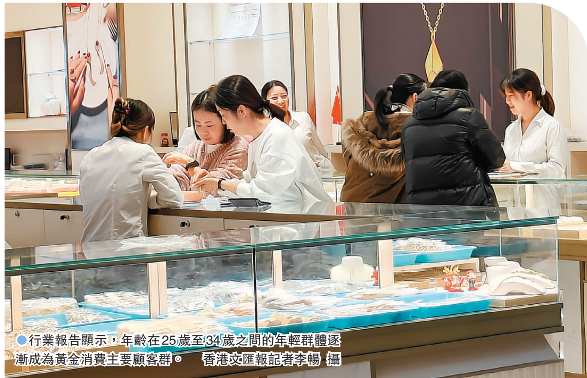
●行業報告顯示，年齡在25歲至34歲之間的年輕群體逐漸成為黃金消費主要顧客群。

從2024年12月18日至香港文匯報記者發稿當日，一月來黃金價格穩步攀升，從每克611元（人民幣，下同）上漲至每克637元，漲幅達3.14%。1月18日當天，國際黃金市場的交易價格漲至2,707.83美元每盎司，國內市場方面，黃金的售價為637.56元/克。香港文匯報記者走訪發現，有「北京小水貝」之稱的天雅珠寶城（北方黃金珠寶行業的集散中心）當日金價為每克651元，周大福等品牌金店的價格大約在每克827元左右。