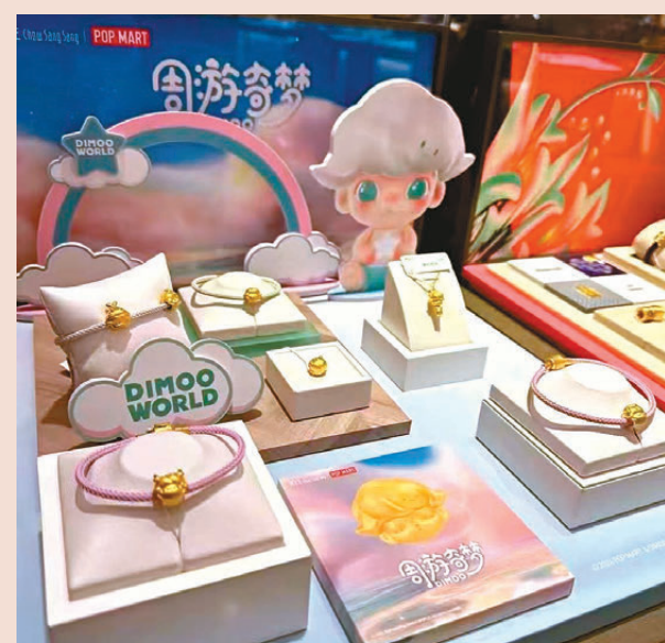
●周生生再次攜手潮玩領軍品牌泡泡瑪特的經典IP之一DIMOO推出聯名款金飾。

此外，不少品牌還開始嘗試將黃金與貼紙相結合，並與各大IP聯名推出新產品。如曼卡龍與《甄嬛傳》聯名推出的黃金甄嬛小像，由足金打造，克數雖不多但價格親民，讓劇粉們輕鬆收藏無壓力。黃金品牌與IP的聯名合作，成功顯獲了黃金首飾在大眾心中的「老古板」形象，賦予了其新的生命力和時尚感。