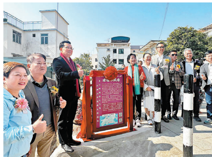
▲揭牌儀式昨日在修復後的「塘福小城牆」旁舉行。