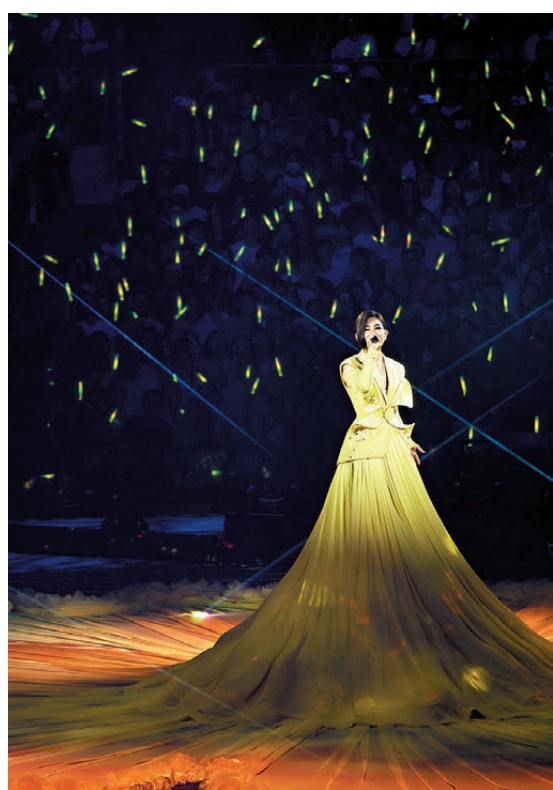
●梁靜茹被譽為療癒系歌手。

感受到更深層的情感連結，讓每一首歌曲、每一個音符都與歌迷產生共鳴，對於香港的粉絲而言，這將會是一個難以忘懷的夜晚，一同創造屬於自己的美好回憶。 梁靜茹當年以一曲《一夜長大》踏入樂壇，之後推出《勇氣》、《分手快樂》及《會呼吸的痛》等歌曲，逐步奠定「情歌天后」之稱號。被譽為療癒系歌手的她，歌聲像穿越時光成為無數人心靈的慰藉，無論是面對失戀的痛楚，還是生活中的低谷，她的每一首歌都帶著溫暖的力量，讓歌迷在音樂中找到勇氣與希望。演唱會選在2月14日情人節之前舉行，梁靜茹預告到時會預先升溫浪漫氣氛，將她一系列樂迷耳熟能詳的情歌帶進紅館。