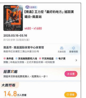
●大麥網上超14萬人標註「想看」王力宏南昌演唱會。

去年9月，「灣區升明月」2024大灣區電影音樂晚會在澳門舉行，王力宏現場演唱歌曲《我們的歌》，這意味著王力宏正式復出。同年12月，王力宏在音樂節現場官宣了他的個人巡迴演唱會於2025年開跑，並感觸地表示：「我有一度以為自己再也站不起來，再沒辦法回到你們面前了。過去一年，我把行程安排得滿滿的，每隔一周，我都會飛到一個城市，為大家唱歌。」「一路走一路唱，對我而言是一場自我療癒的旅程，飛來飛去會累，但這是久違的幸福。」