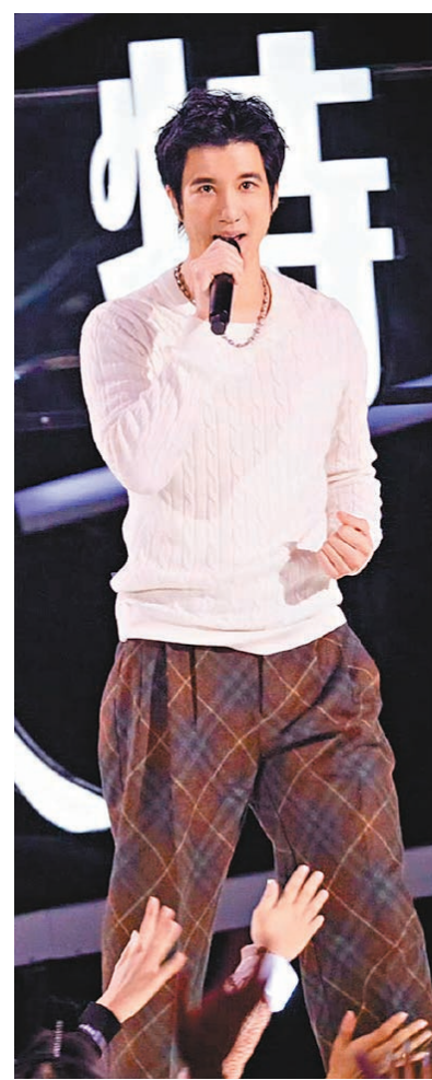
●王力宏宣佈將啟動全新巡迴演唱會。

香港文匯報訊 台灣歌手王力宏順利挺過離婚風波，演藝工作也逐漸回溫，豈料王力宏近日遭不法分子冒充公司名義向粉絲騙財，王力宏工作室表示已就事件報警處理，特別提醒歌迷要提高警覺，小心保護個人資料及財產，慎防上當！