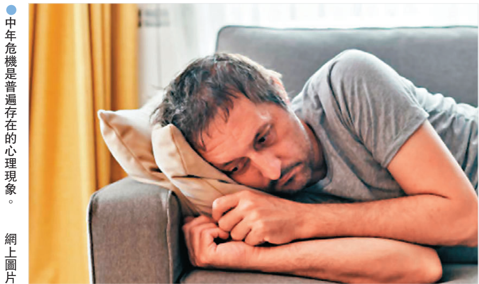
●中年危機是普遍存在的心理現象。

學研社成員，從事幼兒教育寫、教、編達二十多年，在書海瀚論中尋找方便之門，喜歡發掘兒童行為背後的心路歷程，現為自由撰稿人，並把好奇投向歷史上小屁孩的成長故事。