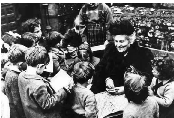
●意大利心理學家兼教育家瑪利亞·蒙特梭利。

4. 激發自發性學習：強調讓孩子從日常生活和自身興趣中汲取知識，從而激發孩子的學習動力與積極態度。