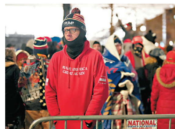
●特朗普支持者冒寒在街上等待就職禮開始。

香港文匯報訊 大批極右「特粉」4年前參與國會暴動，當中多人近年陸續受審並被裁定罪名，特朗普宣稱重返白宮後便會特赦這批暴徒，令特粉欣喜若狂。《華爾街日報》報道，一眾暴徒如今在特朗普就職前夕，紛紛重返華盛頓慶祝，甚至有人佩戴電子腳鐐出席。