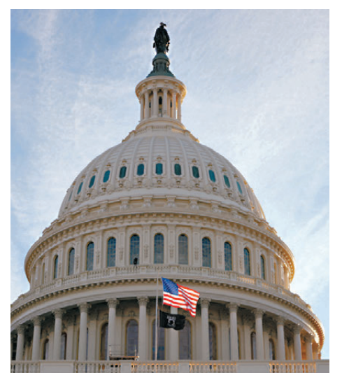
●美國國會如特朗普所願，暫停下半路。