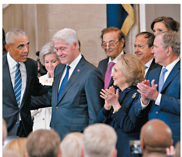
●奧巴馬（左起）、克林頓、希拉里及喬治·布希繼早前卡特國葬後，再次同框。