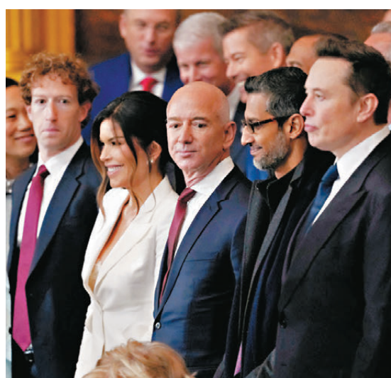
●扎克伯格、貝索斯及馬斯克等科企巨頭現身支持特朗普。