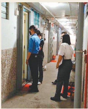
●房屋署職員家訪公屋租戶。申訴專員公署報告圖片

申訴專員公署向房委會及房協提出 31 項改善建議，包括探討與內地建立渠道以獲取租戶是否擁有內地或澳門特區物業資料；將「富戶政策」涵蓋所有出租屋邨的租戶、檢討周期性家訪的安排、與土地註冊處建立核對機制、加強刑罰等。公屋住戶每兩年要申報有否擁有本地物業，公署提醒要嚴格審核申報表，發現有可疑，可以及早跟進和調查。