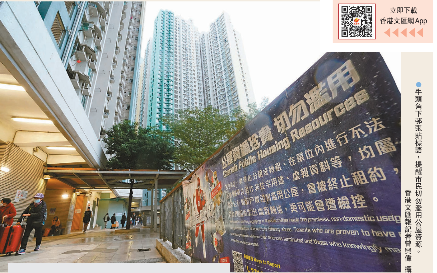
●牛頭角下邨張貼標語，提醒市民勿濫用公屋資源。