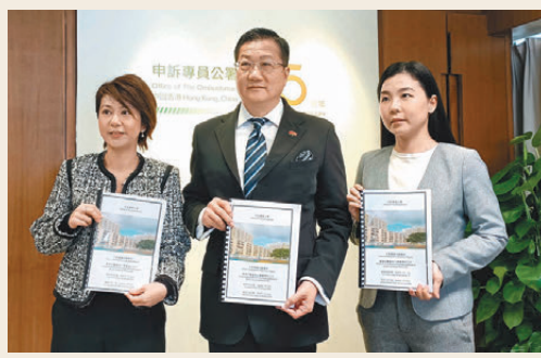
●申訴專員陳積志(中)肯定房委和房協打擊濫用公屋取得成效，並提出 31 項改善建議。

申訴專員公署相關調查報告昨日出爐，當中的第六章特別指出，現屆特區政府着力打擊濫用公屋，例如房委會通過一系列加強打擊濫用公屋及優化「富戶政策」的新措施，房屋署亦與其他政府部門合作採取多項新措施。房協也在擴大「富戶政策」的涵蓋租戶。