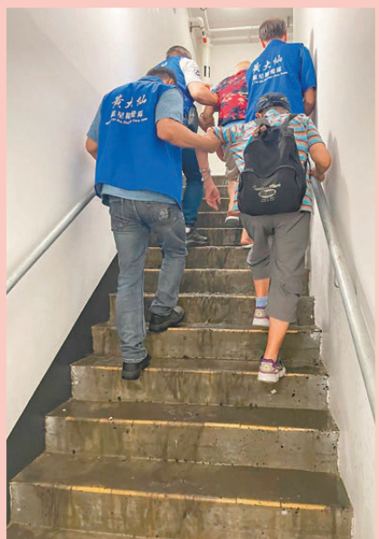
●關愛隊支援受影響的長者出行。