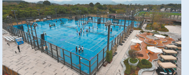
▲小朋友試玩高爾夫球。▲西沙GO PARK昨日開幕。