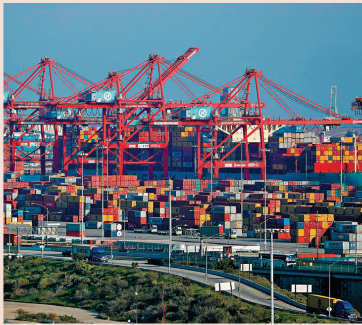
● 中方多次表明立場，認為貿易戰、關稅戰沒有贏家。

特朗普周二較早時表示，他的團隊正討論對墨西哥和加拿大徵收約25%的關稅，原因是兩國允許大量非法移民越過邊境進入美國，且沒有嚴厲打擊毒品，使罪案和毒品問題衍生，指出在兩國解決這些問題前，將要付出代價。加拿大總理杜魯多對此表示，一旦美國落實對加拿大加徵關稅，必會加快速度作出報復。