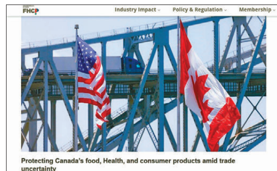
● 製造業協會力促政府在美國關稅威脅下保障各方利益。

彭博社指出，特朗普對發展AI的舉措，與歐洲漸行漸遠，在如何監管AI並與中國競爭的問題上，引發與歐洲之間的衝突。此前歐盟在私隱和安全方面頒布更嚴格的科技立法，令一些領先的AI公司感到不安。有專家則警告特朗普的態度，令AI領域的護欄愈來愈少。美國康奈爾大學法學院教授帕斯夸雷稱，美國短期內可能受益，但不利於長期發展，特朗普在為加強AI領域投資掃清障礙，降低監管風險，但設置護欄同樣理由充分，監管是為了引導企業不要生產不安全的產品，而現在在美國政府可能讓企業自行決定。