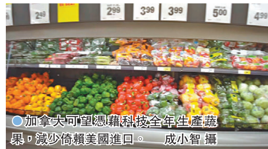
● 加拿大可望憑藉科技全年生產蔬果，減少倚賴美國進口。