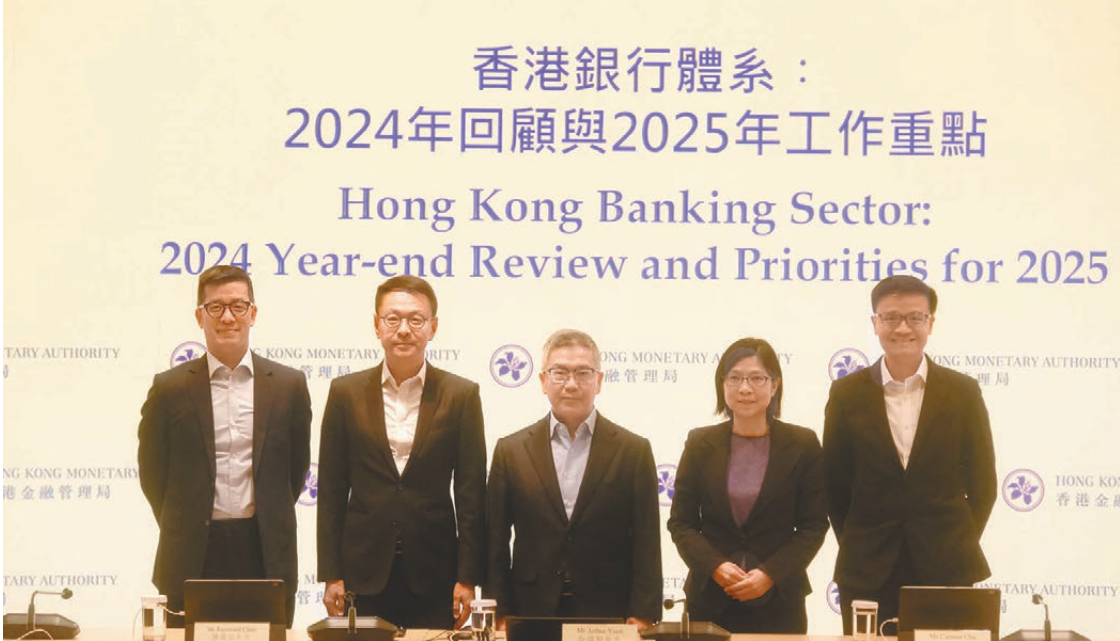
●金管局昨日公布2024年回顧與2025年工作重點。中為阮國恒。

為1.99%，接近2%的長期平均水平。阮國恒稱，在利率前景不明朗下對資產質素下降已有預期，而本港過去一段時間特定分類貸款比率上升，主要反映內地民營發展商的風險敞口，但根據初步估算，去年第四季初步數據水平較第三季大致平穩，強調銀行信貸風險可控，他又指不良率的壓力並非主要來自商業房地產，亦來自中小企及個人信貸。