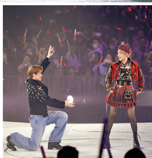
▲張敬軒十分敬重前輩陳慧嫻。