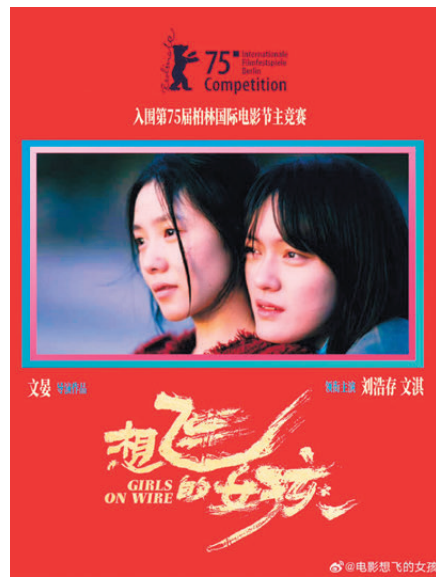
▲劉浩存和文淇主演《想飛的女孩》。