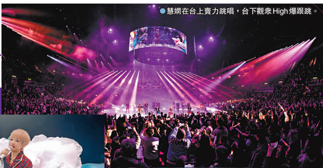
●慧嫻在台上賣力跳唱，台下觀眾High爆跟跳。