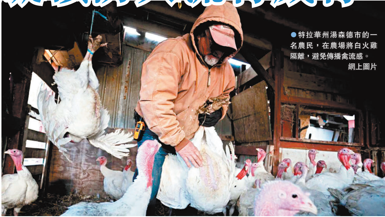
●特拉華州湯森德市的一名農民，在農場將白火雞隔離，避免傳播禽流感。網上圖片

美國喬治敦大學全球公共衛生專家戈廷廷發文批評，指特朗普宣布退出世衛是一次災難性的決定，對美國衛生安全和創新優勢造成嚴重傷害。他認為特朗普此次在未經國會批准的情況下退出聯合國機構，可能會面臨法律上的挑戰。