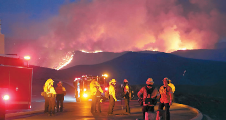
●消防員在卡斯泰克湖地區撲救山火。

路透社報道，洛杉磯以北約80公里的卡斯泰克湖地區周三（1月22日）爆發新火頭（圖），被命名為休斯大火，已吞噬大範圍的樹木和灌木叢。洛杉磯縣消防局局長馬羅內表示，目前火勢仍未有效控制。華盛頓州中央皮爾斯縣的山火專家韋格利說，這場山火