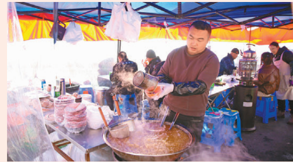
●在瀋陽蘇家屯迎春大集上，冒着熱氣的酸酸菜新鮮出鍋。

農貿街市，與東北大集一樣，是匯聚地域特色、最具市井氣息的商業形態。位於瀋陽市瀋河區方城內的大東副食品商場前身是形成於1829年的「小東門菜行」，至今已有近200年的歷史，是首批「瀋陽老字號」企業之一。目前，經營面積約5,500平方米，經營各類商品7,000餘種，是超規模的商貿綜合商場。今年春節前夕，這裏在匯聚了遼寧本地和山東、河北、陝西等地的新鮮蔬果、特色美食之外，還增加了鮮花作為新年貨，包括遼寧瀋陽的玫瑰、遼寧凌源的百合，豐富了新年的餐桌，也扮靚市民新春的居家氛圍。