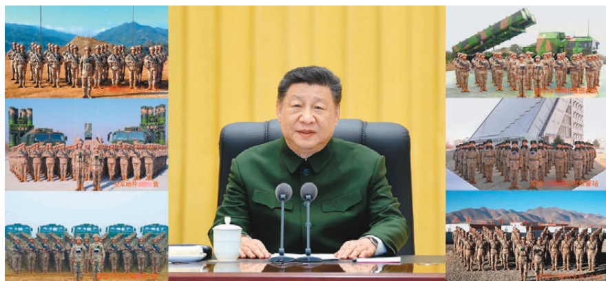
●1月24日，習近平同南部戰區陸軍某旅任務分隊、東部戰區海軍岸艦導彈某團值班分隊、中部戰區空軍地空導彈某營、軍事航天部隊某監測預警站、鄭州聯勤保障中心汽車運輸某團2營、武警西藏總隊日喀則支隊執勤3大隊官兵進行視頻通話（拼版照片）。

香港文匯報訊（記者 于珈琳 瀋陽報道）琳琅滿目的火紅年貨、香氣四溢的傳統美食、色彩斑斕的節日鮮花……擁有近200年歷史的遼寧瀋陽大東副食品商場在春節前夕持續「上新」，迎來如織人潮。隨着近年瀋陽文旅的持續火爆，這座充滿濃市井煙火氣的農貿街市也煥然一新成為遠近遊客的「打卡」目的地之一。特別是小年剛過，採買年貨的人們在一個個熱氣騰騰的檔口前排起長龍，喜慶的年味撲面而來。有不少留學生也專程來到這裏，尋味中國年。