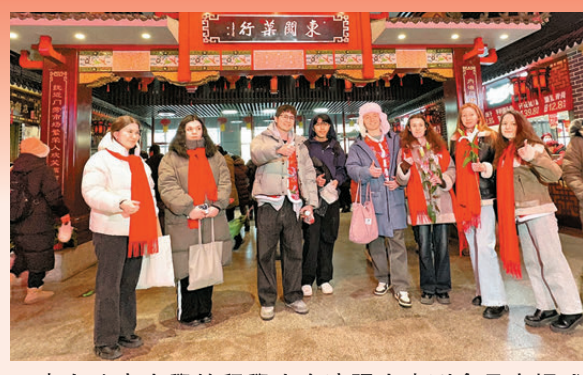
●來自遼寧大學的留學生在瀋陽大東副食品商場感受舌尖上的中國年。