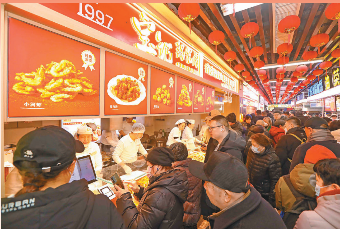
●瀋陽特色美食「寶記鍋包肉」的檔口前人頭攢動，不少瀋陽市民和遊客排隊1小時等待美食出爐。