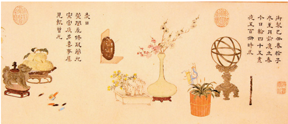
●清·董邦達書畫御製己丑春帖子圖卷(局部)

清代宮廷也通過各種民俗活動祝賀並祈望新年——從臘月初八到正月十五，張掛門神、對聯，創作歲朝清供，書寫春帖子，得祿日「得鹿」，陳設各類包含吉祥紋飾、具有吉祥寓意的器物。「福潤致祥」單元中的「娃娃門神」、「乾隆款粉彩雙鳳耳」、「乾隆款別紅飛龍宴盒百鹿尊」、「白玉螭雙壁壁掛」、「粉彩大吉葫