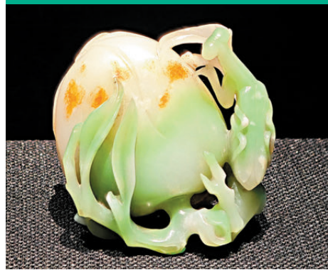
●清·白玉巧雕螳螂蟠桃