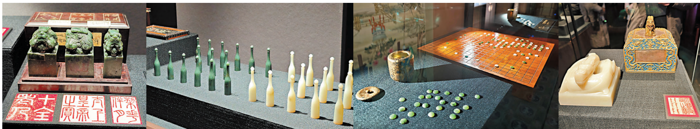
●清·碧玉龍鈕「梨花伴月」印、「太上皇帝之寶」、「十全老人」印(從右到左) ●清·玉雙陸棋(右) ●清·玉圍棋 ●清崇德·白玉盤龍鈕「大清受命之寶」