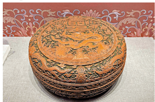
●清·乾隆款別紅飛龍宴盒