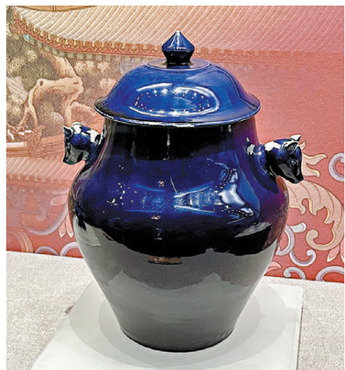
●皇帝冬至祭天時使用的「清·霽藍雙獸耳蓋罐」，是乾隆時期單色釉的代表作品。