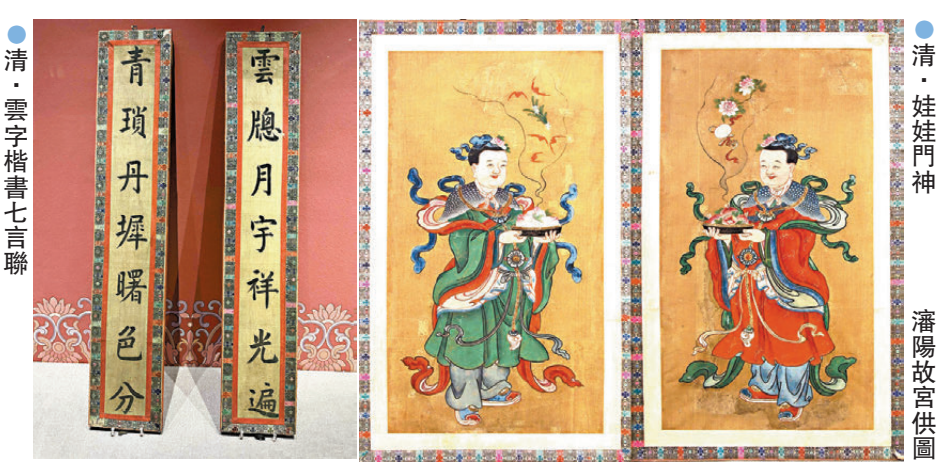
●清·雲字楷書七言聯

同時，近十年來首次展出的「董邦達書畫御製己丑春帖子圖卷」，則是少有的將詩與畫融為一體的春帖子形式。其上所寫的五言詩和七言詩，是乾隆皇帝為己丑年(1769)《歲朝圖》所題，表達對新春的祈盼和祝福。林城濤介紹，春帖子是宮中詞臣於立春之日向皇帝進呈的詩作，多為五言、七言絕句。清代除詞臣外，皇帝本人也撰春帖子，乾隆皇帝所作帖子詞數量尤其可觀，而從乾隆二十七年(1762)開始，每年元旦開筆的24字吉語「宜入新年，萬事如意，三羊開泰，萬象更新，和氣致祥，豐年為瑞」則由乾隆、嘉慶兩位皇帝連續書寫了58年。