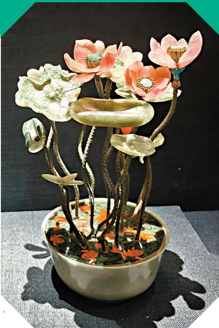
●清·青玉盆玉石荷花盆景

清代白玉巧雕螳螂蟠桃亦給人眼前一亮的感覺。桃上半部雕琢一隻展翅飛翔的蝙蝠，下半部巧妙利用玉中自身所帶的翠綠色雕為桃葉、枝梗，桃枝上圓雕一隻螳螂。清宮舊藏和田玉中，這種白玉中帶有鮮艷綠色的玉料極為罕見。