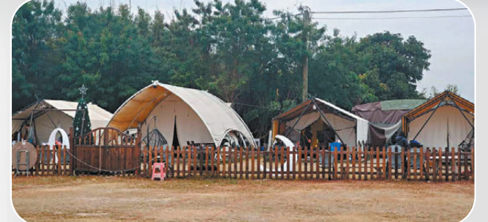
●羅淑佩希望能探索有潛力的島嶼旅遊，讓遊客體驗在島上來個豪華式露營。圖為香港一個露營地。

香港文匯報訊（記者 文禮願）香港特區政府文化體育及旅遊局局長羅淑佩日前接受香港文匯報訪問時，闡述了她對本地旅遊發展的看法。她強調，無論是香港市民還是旅客，都應該從香港的文化與旅遊活動中獲得快樂。她表示，以往那些接待不周的亂象，對整體社會不會有很大好處，只有大家都開心才有一個好的氛圍。