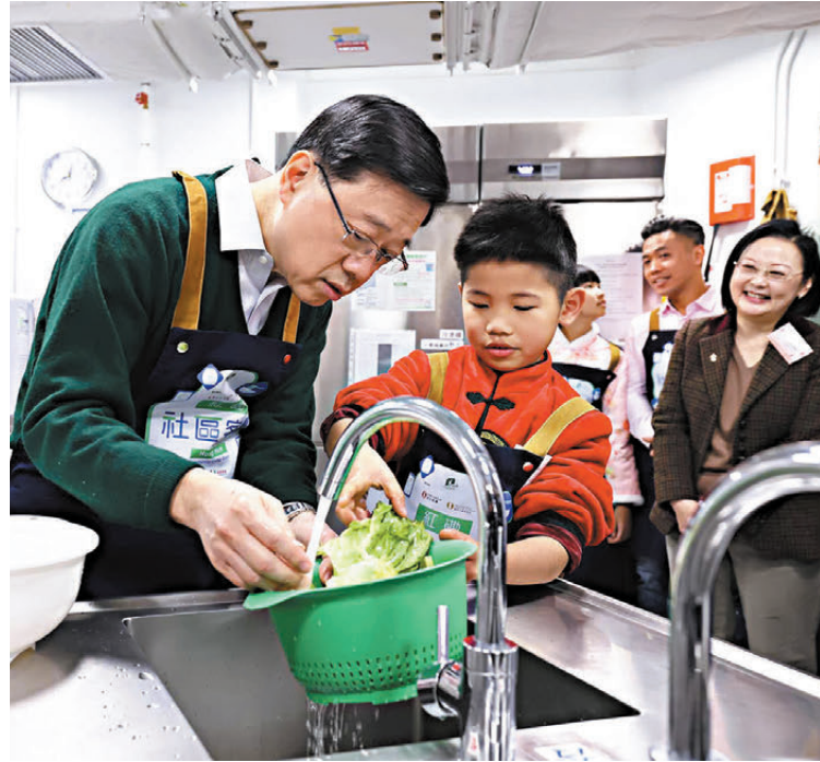
●李家超與小朋友一起洗菜。