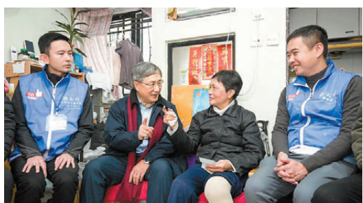
●卓永興鼓勵周女士多到公園走走，為健康活好每一天。

特區政府政務司副司長卓永興昨日探訪長者和基層家庭，向他們送上政府的關愛和祝福，隨後去了維多利亞公園逛花市，看看市道和買些年花響應本地消費。他表示，農曆新年是中國人最珍視的節日，是家庭團聚、親友互賀、停歇休息的美好時光。還有幾天便過年，大家不妨去逛逛維園或其他地區的花市，買點年花為新年增加氣氛和討個好運。