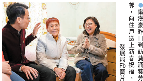
●甯漢豪昨日到訪葵涌葵芳邨，向住戶送上新春祝福。

民政及青年事務局局長麥美娟昨日在帖文中說，昨天她到屯門田景邨與當區關愛隊和區議員們探訪3戶家庭，也是關愛隊持續跟進的家庭。「我們與居民們聊天交流並送上賀年福袋，當中更有關愛隊義工親手織出的『溫暖牌』頸巾、手套和帽子，希望在寒冷的節日裏讓大家感受到不一樣的溫暖和祝福。」麥美娟表示，在交流中，基層家庭非常感謝關愛隊和區議員們經常探望關心他們，更不時協助他們進行家居清潔或簡單維修，解決日常生活困難，讓他們居住得更溫暖。