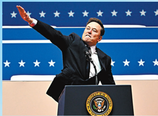
全球首富馬斯克早前疑似作出納粹敬禮，惹起爭議。資料圖片