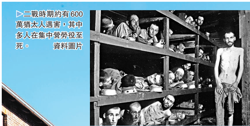
二戰時期約有600萬猶太人遇害，其中多人在集中營勞役至死。資料圖片