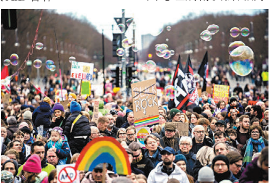
示威者高呼口號抗議。

馬斯克在演說中稱，德國政府正大力打壓言論自由，AfD為了德國和歐盟更多成員國的「自決權」，必須不斷戰鬥。他還暗示保守派右翼勢力在德國沒有得到尊重，宣稱要保護德國傳統文化和價值觀。