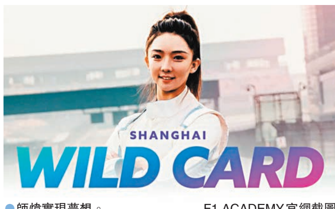
●師煒實現夢想。F1 ACADEMY官網截圖

另一場，利物浦在加普梅開二度下以4:1大勝萊士域治。「紅軍」主帥史洛賽後避談爭冠一事，指球隊會集中做好自己。