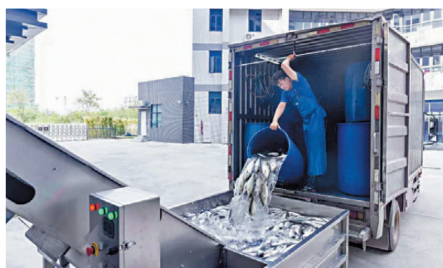
●廣東和江西按香港市場變化情況及時調整及補貨。圖為珠海一水產公司的供港新鮮水產品。資料圖片