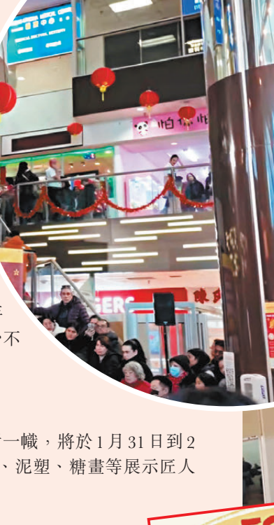
●(上圖)美國商店推出各種揮春和裝飾品。(下圖)身在美加的僑胞，仍可感受春節的氣氛。