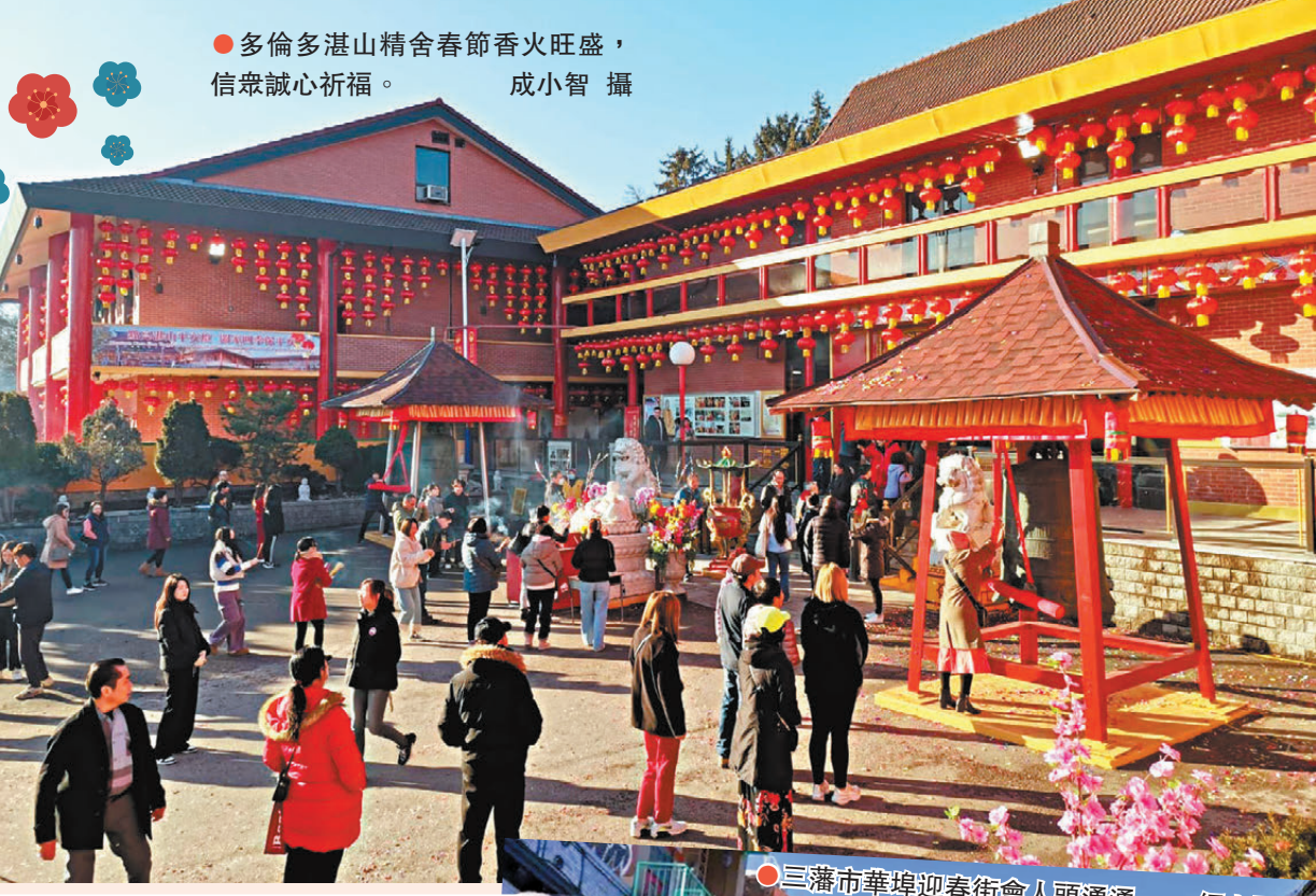
●多倫多湛山精舍春節香火旺盛，信眾誠心祈福。