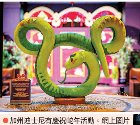
●加州迪士尼有慶祝蛇年活動。網上圖片