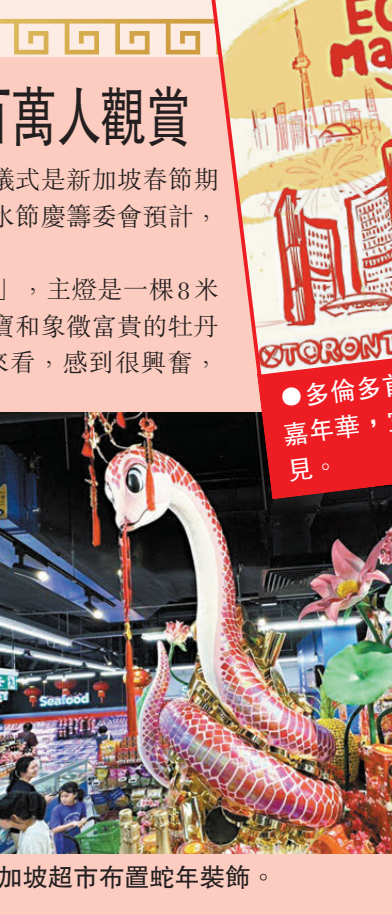
●新加坡超市布置蛇年裝飾。