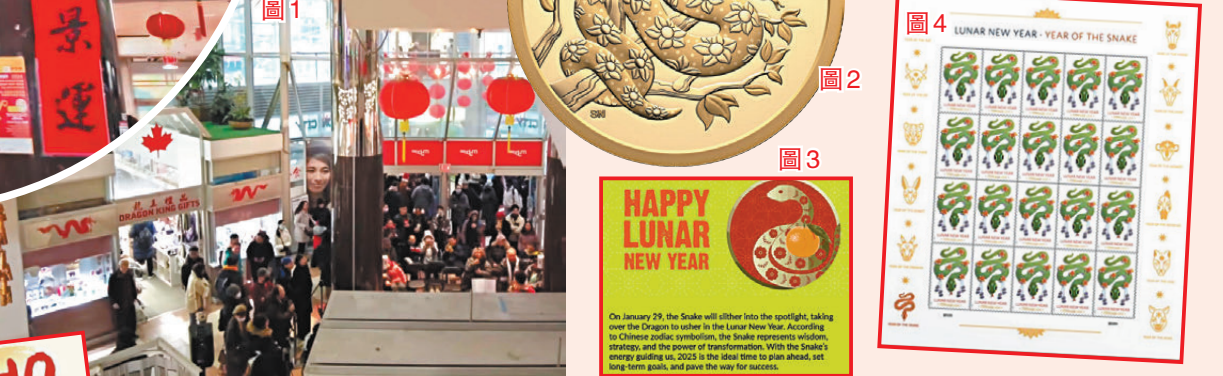
●(圖1)加拿大華人商場張燈結綵迎新歲。(圖2)華人傳統喜歡儲存黃金，加拿大推出蛇年金幣。(圖3)加拿大主流超市借助農曆新年促銷熱門商品。(圖4)美國發行蛇年郵票，很多人集齊全部12生肖郵票收藏。

華裔人口接近70萬的多倫多是華人比例最高的北美城市，今年首次在市中心一帶舉行春節嘉年華，還在市政大樓上空舉行煙花音樂匯演，讓市民享受歡樂氣氛。春節嘉年華創辦人表示蛇年象徵智慧、變革和新生，希望藉此展現中國傳統魅力，傳遞出新年充滿希望和喜悅。主流傳媒廣泛報道這次盛事，加上旅遊局配合宣傳，有助凝聚華人社區與其他族裔的聯繫。