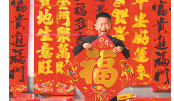
●蛇年新春將至，「福」字往往與春聯一起走進百姓家。圖為一名小朋友在山東一年貨市場上展示新購買的「福」字。新華社

隨着春節的臨近，我在市場上購買了一些美麗漂亮的春聯，當然也少不了「福」字，也會情不自禁地陶醉在「福」的年味裏。