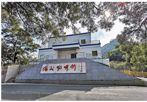
伯公坳哨所

深圳河上的羅湖橋，作為廣九鐵路唯一的邊境橋樑，中國南大門「第一哨」，可以說是中國與外部世界百年互動的親歷者，連接的不僅僅是深圳與香港的地理，還連接着中華民族從屈辱到崛起、從封閉到開放的歷史軌跡，連接着東西方文化與意識形態的博