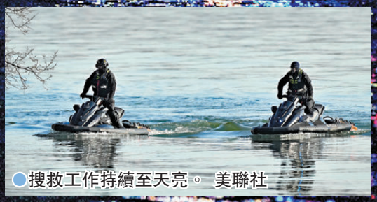
●搜救工作持續至天亮。