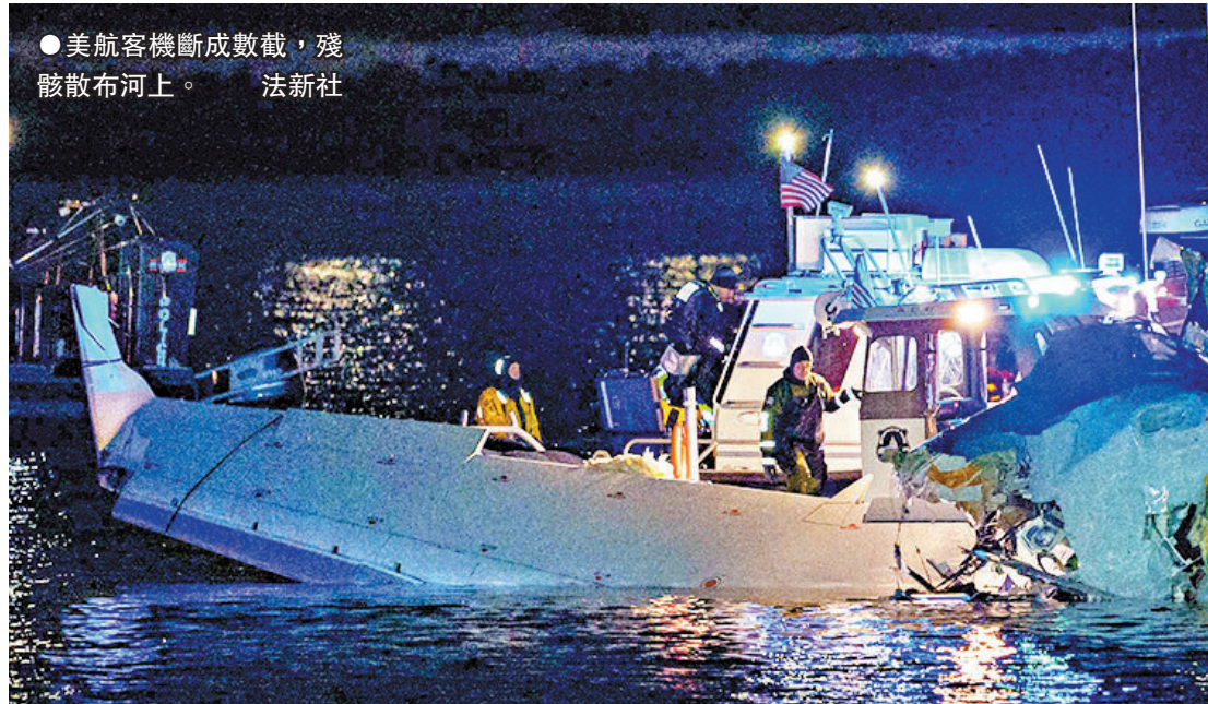
●美航客機斷成數截，殘骸散布河上。

香港文匯報訊 美國首都華盛頓周三(1月29日)晚發生客機與美軍直升機相撞的罕見意外，一架載有60名乘客和4名機組人員的美國航空公司客機，在準備降落里根國家機場期間，在機場附近的波多馬克河上空，與一架軍方黑鷹直升機相撞，兩機墜毀河中。大批救援人員趕到現場搜救，當局稱暫時在兩機殘骸上共發現28具遺體，未發現生還者跡象，相信事故中無人生還。