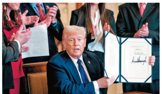
●特朗普簽署上任後首項法案，加強打擊非法移民。彭博社

視人道狀況和國際法。2002年，時任美國總統布希政府在關塔那摩灣美軍基地建立拘留設施，關押「911」襲擊的嫌疑恐怖分子。設施亦用於關押在戰爭或其他行動中拘留的人士，但多年來不時傳出任意拘押、虐囚逼供、侵犯人權等問題。