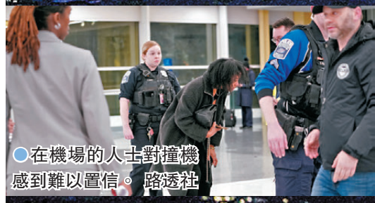
●在機場的人士對撞機感到難以置信。

香港文匯報訊《紐約時報》指出，由於華盛頓氣溫相當寒冷，一旦乘客或機組人員落水，恐怕會有失溫等狀況，影響搶救生還者的機會，而現場颶起大風，亦妨礙搜救工作。當局在事發後採取大規模搜救行動，但華盛頓氣溫約攝氏10度，波多馬克河的水溫更只得約攝氏1.6度。按照美國國家氣象局的說法，人在攝氏1.6度的河水中，可能在3分鐘內就會失去靈活性，並於15至30分鐘內失去知覺，在此條件下，存活時間估計在30分鐘至90分鐘，超過90分鐘後存活率恐大幅下降。救援行動負責人稱，潛水員面對的是「強風、寒冷與黑暗」。華盛頓消防局局長唐納利指出，搜救難度很高，兩機墜落水域約2.4米深，現場風勢相當大，河面也有冰塊漂浮，水裏很黑又混濁，對救援人員是極危險及難以操作的環境。