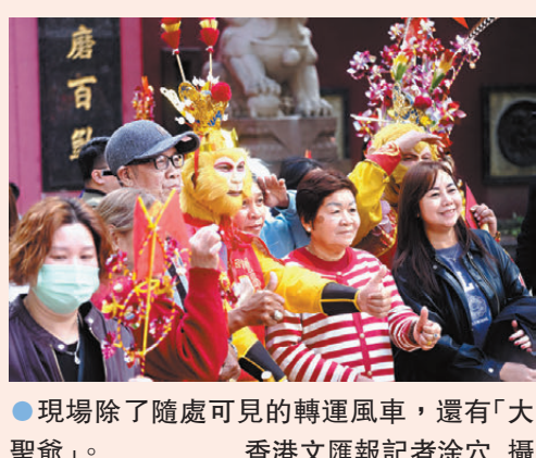
●現場除了隨處可見的轉運風車，還有「大聖爺」。