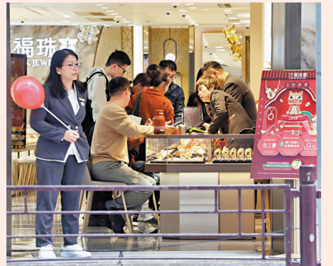
▲受惠於深圳恢復及擴充「一簽多行」等措施，遊客區珠寶店的訪港旅客明顯增加。