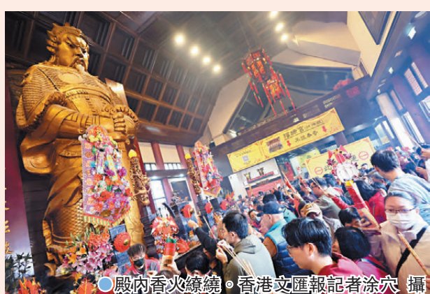
●殿內香火繚繞。