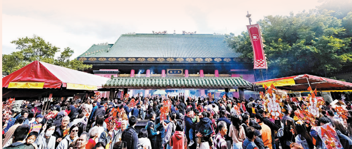
●大批市民在年初三到沙田車公廟參拜祈福。

據部分酒店業界反映，年廿九至大年初四入住率已近100%，至大年初六及初七才見回落，「可見今年春節假期，本港酒店的預訂和入住率都非常高。」