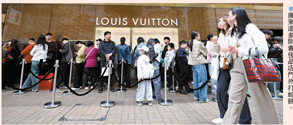
●廣東道多間奢侈品店門外打蛇餅。