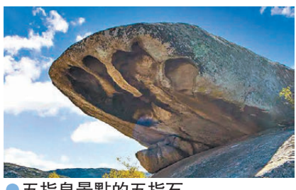
●五指泉景點的五指石