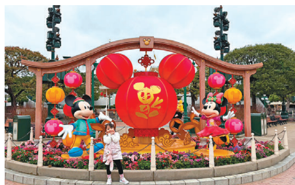
▲▲美國小鎮大街新春布置