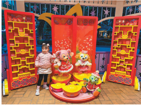
●Duffy與好友新年打扮裝置

今個蛇年，由即日起至2月16日，香港迪士尼樂園舉行「奇妙年年」蛇年新春慶祝活動，讓大家投入全新「米奇與好友蛇年行大運」，體驗充滿迪士尼特色的新年節慶。蛇年遊走美國小鎮大街，皆大歡喜！除了全新「米奇與好友蛇年行大運」，米奇與好友及Duffy與好友也換上了賀年服飾，為大家送上不一樣的新春限定版「米奇與好友大街狂歡派對」，沿路向大家揮揮手、拜拜年，祝你蛇年一路好運！