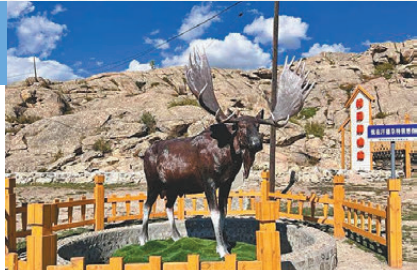
●汗德尕特蒙古族鄉是駝鹿之鄉，圖為當地街頭口袋公園一景。

喇嘛廟則是這裏的特色人文景點，該廟全稱阿爾西喬龍廟（吉祥大法寺），屬藏傳佛教綠度母道場，供奉釋迦牟尼12歲等身像和綠度母，是當地阿爾泰山七旗（27個蘇木）烏梁海蒙古族祭祀拜佛聖地。這兒還擁有阿勒泰市第一家鄉村民俗文化陳列館，主要展示汗德尕特蒙古族鄉的歷史、民俗文化、風俗習慣等內容。