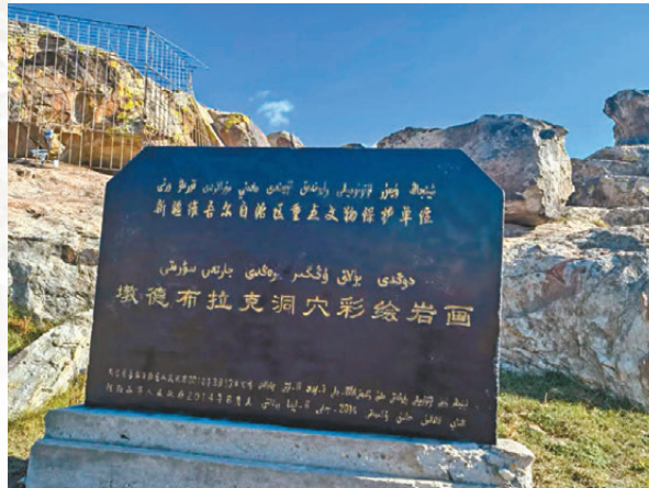
●新疆阿勒泰市汗德尕特蒙古民族鄉墩德布拉克河上游溝谷中的墩德布拉克岩畫景點

《山海經》云：「有釘靈之國，其民從膝下已有毛，馬蹄善走」，這是對內地滑雪最早的文字記載。而在上萬年前，就有手持木杖、背荷弓箭、腳踩毛皮滑雪板的先民在阿爾泰山的雪原馳騁，在他們身旁或前方是拚命逃竄的野牛、野馬、麋鹿……近年來，隨着2022年北京冬奧會舉辦及「三億人上冰雪」帶來的冰雪運動熱潮，地處「中國西北角」的「中國雪都」新疆阿勒泰備受世人矚目。記者早前便隨「機遇中國·開放新疆」港澳台和東南亞華文媒體走進新疆採訪團來到阿爾泰山的峻嶺深谷中，探訪這個「人類滑雪起源地」留存的萬年前洞穴彩繪岩畫——墩德布拉克岩畫。 ●文、圖：香港文匯報記者 應江洪 新疆報道