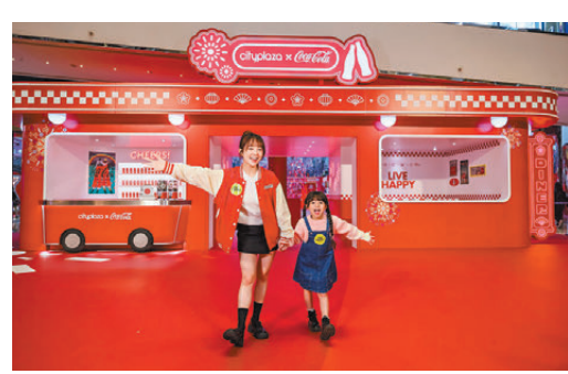
●以復古餐廳打造的打卡及互動區域。

由即日起至2月16日，太古中心與可口可樂攜手呈獻「LIVE HAPPY 快樂 Cheers！」首次以復古餐廳概念打造六大別開生面的打卡及互動區域，讓大家透過一系列趣味的活動和裝置，在輕鬆愉快的舒適環境中，與親朋朋友聚首一堂，盡情傾訴心底話，向對方送上新春祝福。意猶未盡的話，更可於場內商戶入手多款可口可樂聯乘商品，齊齊LIVE HAPPY！