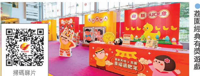
●荔園經典有獎遊戲