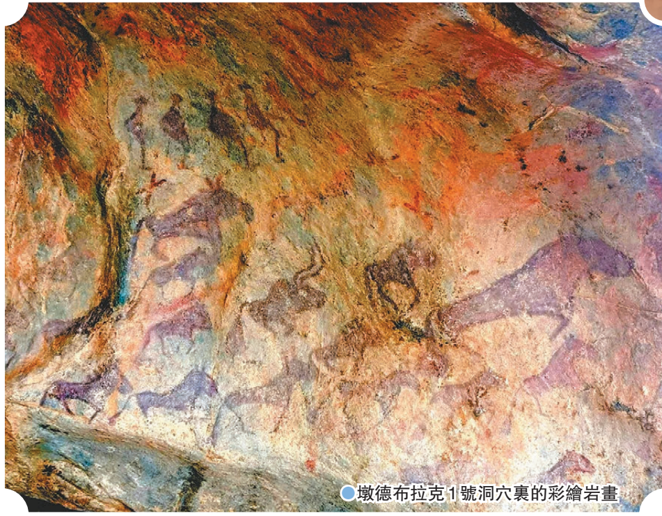
●墩德布拉克1號洞穴裏的彩繪岩畫