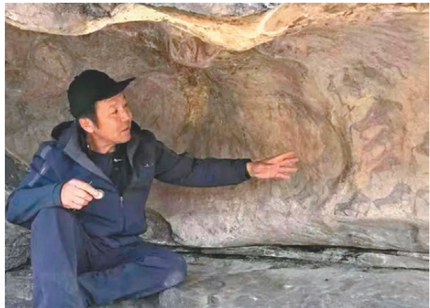
●岩畫看護員在介紹墩德布拉克岩畫。