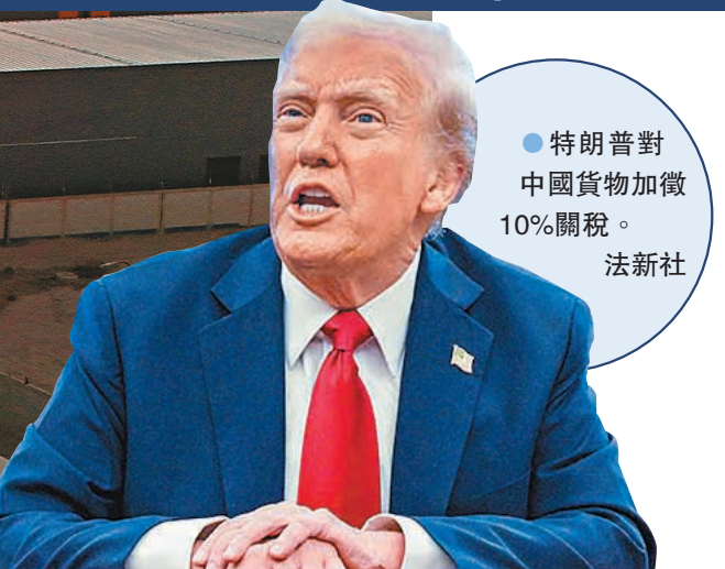
●特朗普對中國貨物加徵10%關稅。