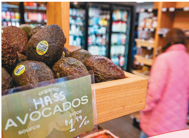
●加州一間雜貨店內的墨西哥牛油果。

埃布拉德也稱，所有美國消費者無論是在超市，還是買水果、蔬菜、肉類和啤酒，都要付出更高的價格。而對於墨西哥產品消費量較大的邊境地區州份，受到影響將更嚴重。