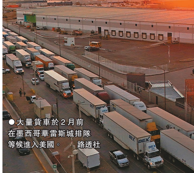
●大量貨車於2月前在墨西哥華雷斯城排隊等候進入美國。路透社

中國駐美大使館發言人劉鵬宇發聲明稱，中美兩國應該透過對話磋商解決分歧，指在貿易戰或關稅戰中沒有贏家，既不符合雙方利益，也不符合世界利益，「儘管存在分歧，但兩國有巨大共同利益和合作空間。」美國白宮發言人萊維特周五確認，周六起將會對加拿大和墨西哥進口的貨物徵收25%關稅，對中國的商品加徵10%關稅。她同時駁斥路透社的報道，指其稱3月1日實施關稅政策是假信息。