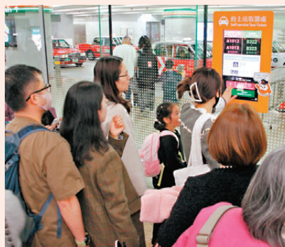
●乘客在西九高鐵站領取籌號等待乘的士回家。