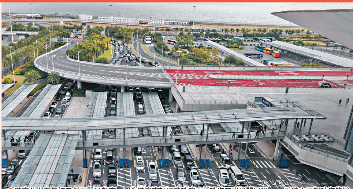
●港車北上在年初三創下單日新高。圖為港澳車輛經港珠澳大橋珠海口岸通關回程。

農曆新年連周末的長假期昨日結束，不少外遊市民循各口岸陸續回港，亦有內地旅客錯峰前來香港遊玩。香港文匯報記者於西九龍高鐵站直擊，抵港大堂人流不絕；的士等候區內亦供不應求，大批乘客領取籌號等的士，平均輪候15至20分鐘才能上車。不少乘客表示，提早至下午回港是希望避開晚上的返港高峰潮。香港特區政府入境處表示，昨日截至晚上9時共有97.7萬人次出入境，逾60萬入境人次中，42.3萬人次屬香港居民。春節假期大批市民外遊，香港亦迎來大量內地遊客，有立法會議員指出，本港各區人流量高，預計對今年春節的生意額大有幫助。