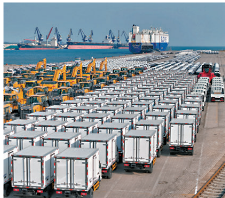
●中方強烈不滿美國對中國輸美產品加徵10%關稅。圖為山東煙台港。資料圖片