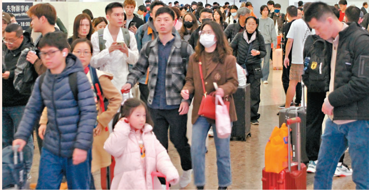
●本港春節假期昨日結束，外遊市民陸續回港。圖為西九龍高鐵站。