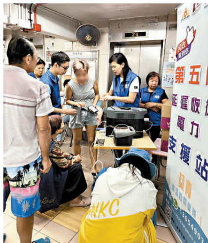
●關愛隊在葵盛西邨第五座停電期間，於大堂設置充電服務，以便居民能為手機等設備充電，與外界保持聯繫。