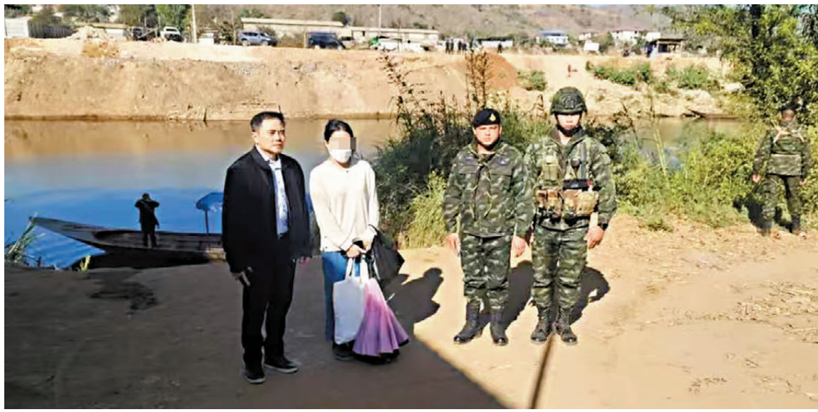
獲救女港人已安全返抵泰國，將盡快安排返港。

國與不同單位協調，並與泰國國家警察轄下的泰國移民局副局長潘塔納，以及泰國司法部轄下專責特別調查及專責打擊人口販運的部門首長開會，安排獲救港人盡快回港，並繼續協助積極跟進所有仍未返港的相關求助個案，全力爭取他們盡快返回香港。