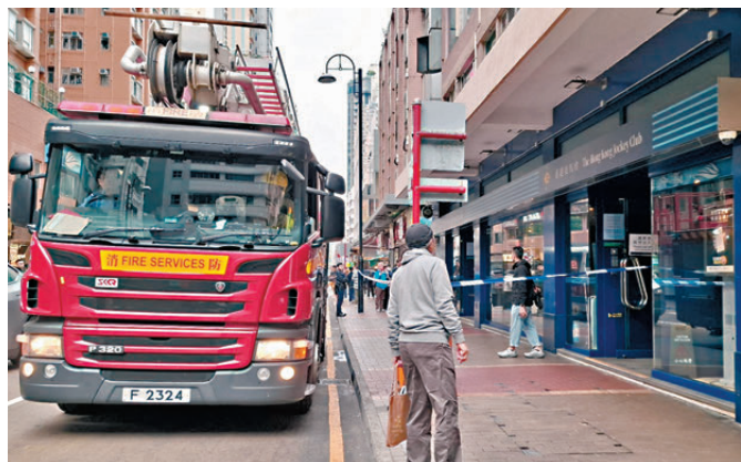
●消防到場將煙霧撲熄。

香港文匯報訊(記者 蕭景源)昨日下午3時半，旺角花園街2號至16號好景商業中心地下的馬會投注站，疑因一個顯示器的電線短路冒煙，需消防到場撲救，投注站一度要疏散人群及暫停服務近3小時，其間一名職員手指輕傷，經敷治後無須送院，前來購買彩票的市民則要改到其他投注站。