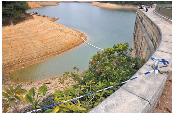
●水務署設置浮條吸油，檢查水質。

四輪朝天，水面漂有疑似溢出的油污。消防蛙人潛入水底搜索，證實車內及附近均無人被困，肇事車輛則滿布泥濘及生鏽，警方經調查後相信車輛與2023年一宗自殺浮屍案有關。水務署則於昨日表示，署方已暫停使用九龍水塘的儲水，並會待完成全面及嚴格的水質檢驗後才會恢復。