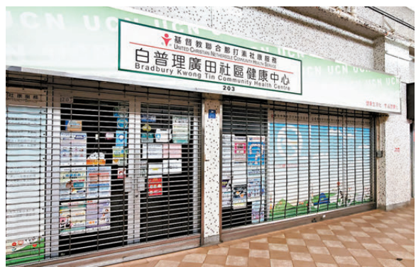
▲死者生前曾在多區掛診。▲47歲醫生伏屍飛鵝山自殺崖，疑因照顧長子壓力爆煲。

香港文匯報訊(記者 蕭景源)一名47歲男醫生，年初二(1月30日)突然離開藍田住所失蹤，妻子報警後，警方前日(2月1日)透過GPS(全球定位系統)發現事主身處飛鵝山自殺崖附近，經陸空搜索終在山崖下尋獲事主，惜已證實死亡。由於死者生前曾透露因照顧長子而感壓力以及有自殺念頭，警方不排除事主因不堪長期照顧家人，身心疲憊下，壓力「爆煲」而尋死，事件再揭照顧者悲歌。