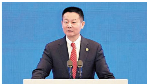
●中國證監會主席吳清指出，要加快改革開放，深化資本市場投融資綜合改革。

場、債券市場規模躍居全球第二位，商品期貨交易額居全球前列，已經到了從高速增长向高質量發展加快轉變的階段，發展質量問題已成為當前制約中國資本市場健康穩定發展的主要矛盾。從融資來看，中國上市公司總量已經不少，但結構尚不合理，上市公司科技含量還不高，支持科技創新和產業轉型升級的作用發揮不夠充分；從投資來看，資