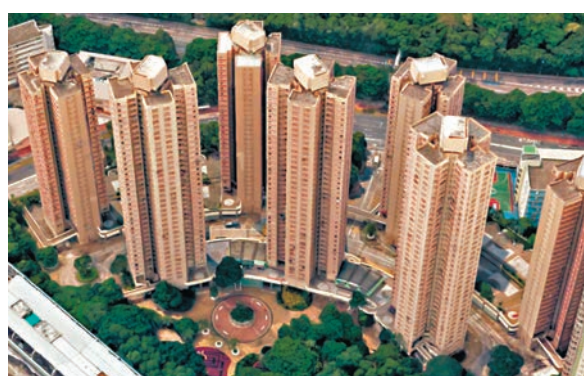
●沙田愉田苑466方呎「送契樓」於自由市場以282萬元成交，呎價6,052元。