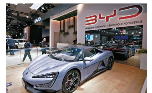
●比亞迪1月累計汽車銷量300,538輛。 資料圖片

零跑汽車(9863)1月交付量25,170輛，同比增長105%。公司此前已宣布2024年第四季度實現淨利潤轉正，提前一年達成單季度盈利目標。