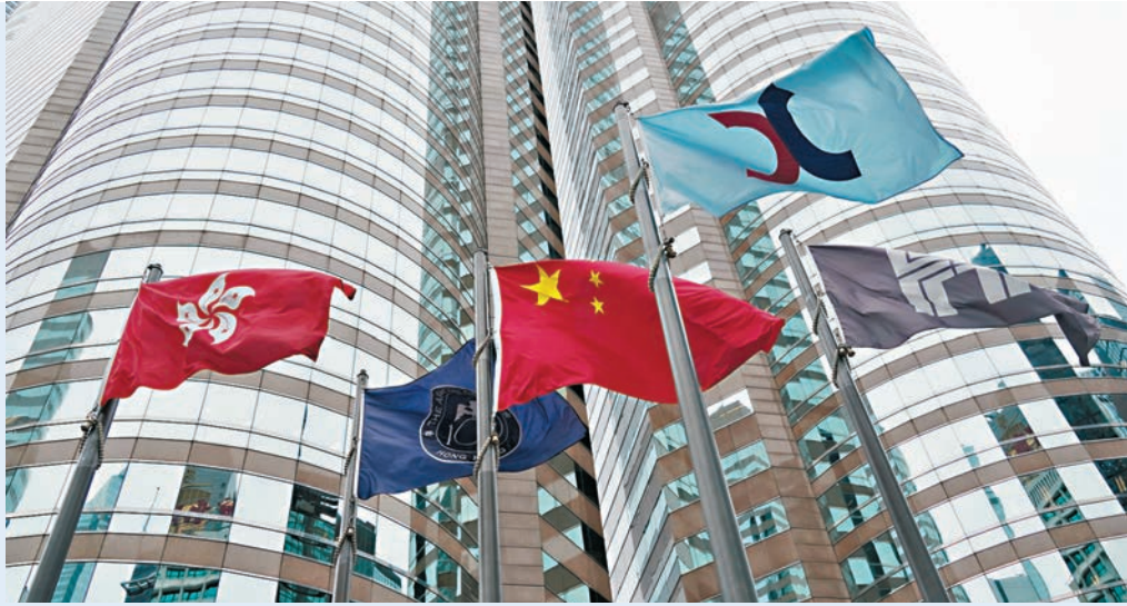
●投資界人士認為，股民在蛇年正月不宜太進取，尤其是當下市場不明朗因素眾多。 資料圖片

港股蛇年首日開市，遇上美國白宮宣布對來自中國的貨品加徵10%關稅，令人擔心港股今日表現。事實上，過往4次蛇年首天恒指有3次皆能紅盤高收，若非特朗普宣布加徵關稅，港股今日的開市表現料不會太差。然而，若論整個農曆正月的投資表現，蛇年正月卻是12生肖年中表現最差的。據恒指公司去年發表的報告指出，恒指在過去4次蛇年的正月均告下跌，跌幅介乎0.5%至6.2%，平均跌3.4%。由於美聯儲局1月不減息，美國又對中國等多國加徵關稅，影響投資氣氛，故今個蛇年正月下跌的機會又多了幾分。 ●香港文匯報記者 周紹基