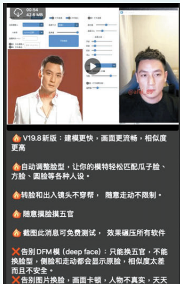
●有不法之徒近日在社交群組兜售「深偽軟件」，聲稱只要付出3000美金，即可提供「任換面」技術。