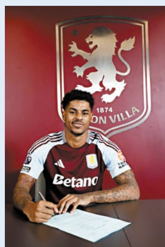
在曼聯連同青訓待了20年，拉舒福特首次離開母會。

另一方面，在曼聯青訓出道並一直效力了20年的翼鋒拉舒福特，昨落實外借到阿士東維拉至季尾，設有4,000萬英鎊的買斷條款。「福仔」去年12月不敵諾定咸森林一戰後已遭到雪藏，更被艾摩廉公開批評其操練態度。拉舒福特在社交平台發聲明祝福曼聯在本賽季餘下時間一切順利，「很幸運有幾間球會接觸我，加盟維拉原因很簡單，因為我欣賞這支球隊和教練的雄心。我(離隊)只想踢球，十分期待新開始。」