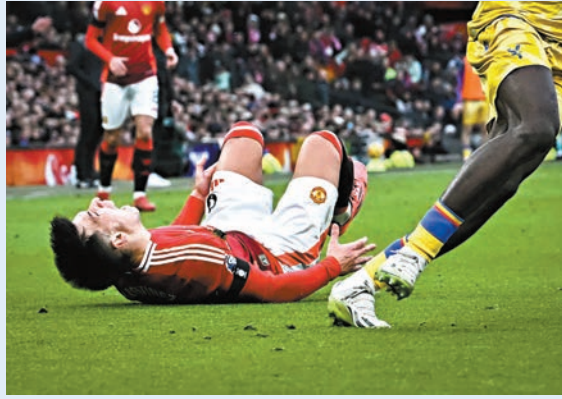
利辛度馬天尼斯痛苦倒地。