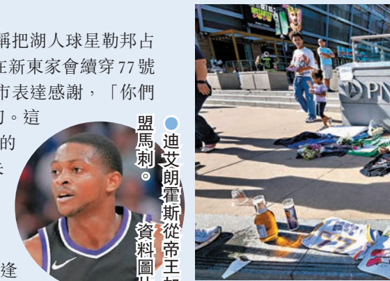
迪艾朗斯從帝王加盟馬刺。

此外，昨日薩克拉門托帝王在多方交易中送出主力後衛迪艾朗斯至聖安東尼奧馬刺，換來芝加哥公牛的查克拉維利。