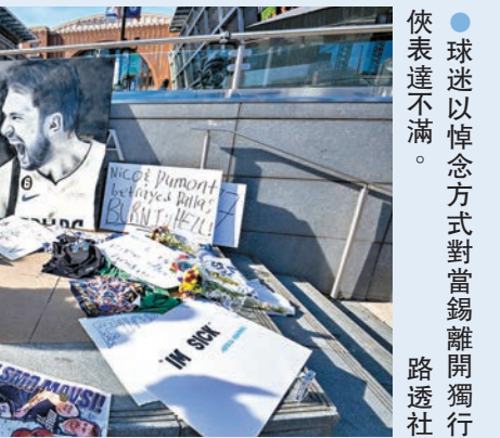
球迷以悼念方式對當錫離開獨行俠表達不滿。