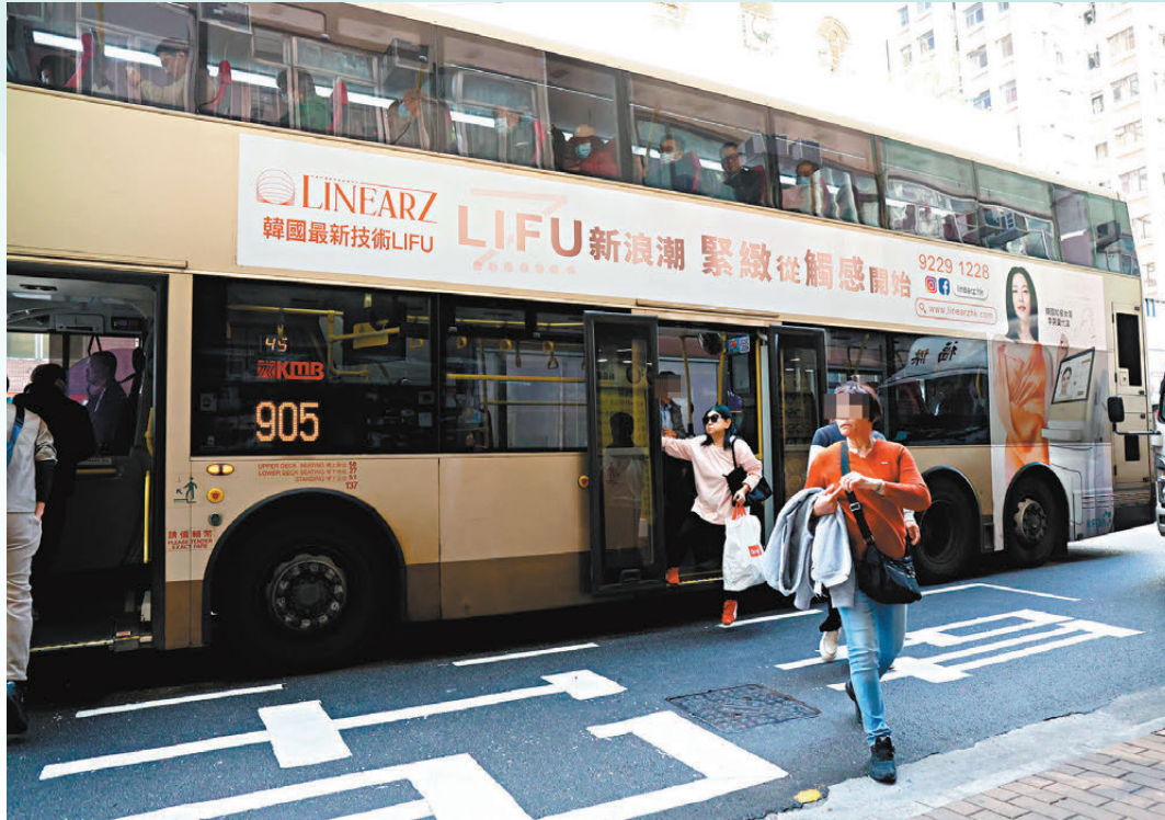
▲905號北行過海巴士在未過海前已有多名長者下車。