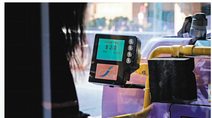
●長者2元乘車優惠衍生長車短搭浪費公帑的問題。