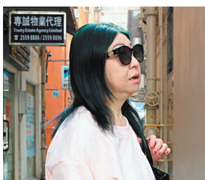
▲姚女士豪氣地表示，不在乎自己要支付多少車費，日後都會見車就上。