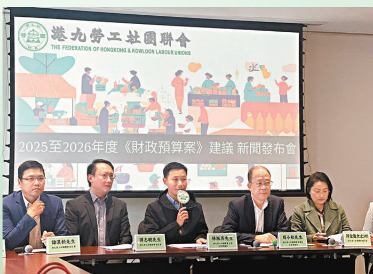
●港九勞工社團聯會在立法會綜合大樓召開記者會，交代對今年財政預算案的建議。

香港文匯報訊（記者 胡恬恬）港九勞工社團聯會昨日公布2025/26年度財政預算案建議書，涉三大範疇的30項具體政策建議，包括維持2元乘車計劃、拓展再就業津貼計劃、延續「派糖」措施、不讓公務員凍薪或減薪、調高簽證費用及來港人才子女的大學學費、為基層平台工作者設立工傷補償保險標準等。