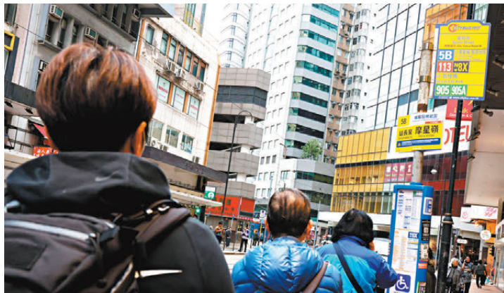
●城巴將5B號線總站由堅尼地城改為延長至摩星嶺，而同時終止摩星嶺至中環碼頭頭的1號線。

至於社會有聲音建議政府削減長者2元乘車優惠計劃，例如限制使用次數等，姚女士稱無所謂，還豪氣地表示，日後都會「見車就上，方便就得。」她亦不在乎自己要支付多少車費，「如果無咗這個計劃，畀多十元買方便都無所謂。」