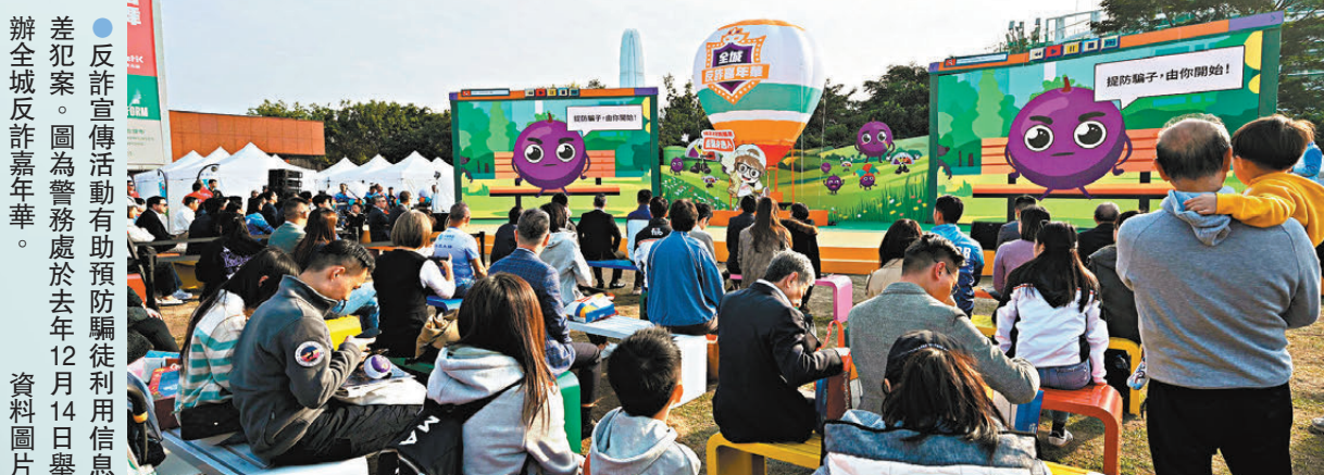
辦全城反詐宣傳活動有助預防騙徒利用信息差犯案。圖為警務處於去年12月14日舉辦全城反詐宣傳活動。