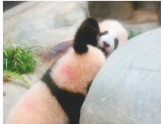
●相親相愛、相互打鬧，就是兩姐弟的幸福「熊生」。