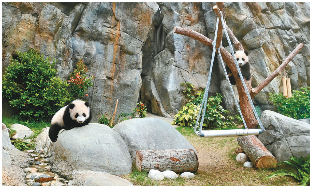
●2月6日，香港海洋公園組織傳媒探訪港產大熊貓龍鳳胎「家姐」、「細佬」，介紹兩隻大熊貓幼崽最新生活情況。圖為大熊貓「細佬」（左）與「家姐」在玩耍。