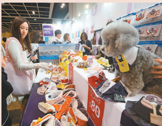
●香港寵物節2025昨日在灣仔會展開幕。圖為參展攤位上寵物用品琳瑯滿目。