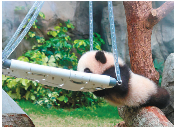
●「細佬」爭不過「家姐」，只好負責推鞦韆。