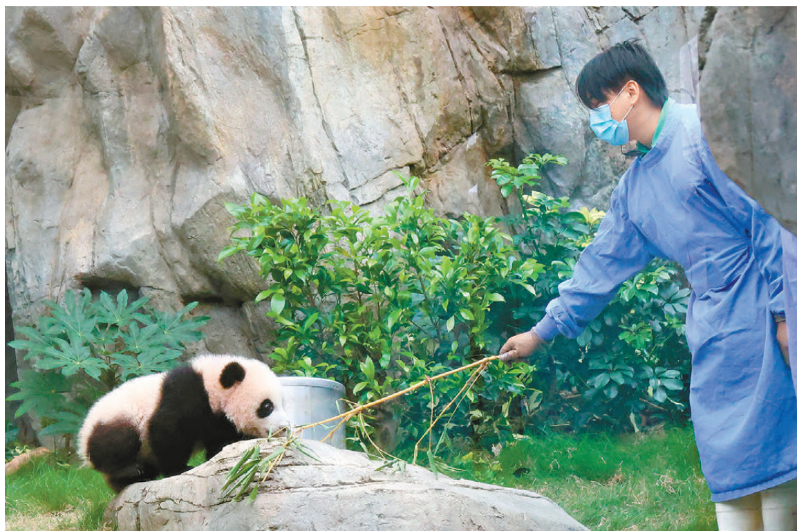
●護理員和雙胞胎互動。

港產大熊貓龍鳳胎寶寶將於下周六（15日）迎來半歲生日，屆時會有亮相儀式，翌日正式與公眾見面。海洋公園昨日安排傳媒率先探訪這對大熊貓寶寶，見牠們由出生時僅體重100克的虛弱小肉團，已暴風式成長成兩隻體重均逾11公斤的調皮「流心芝麻湯圓」。「家姐」和「細佬」在樹上、草地上四處攀爬打滾，見到記者也毫不怯場，玩累了就爬到樹丫上呼呼大睡，平衡功夫超凡。