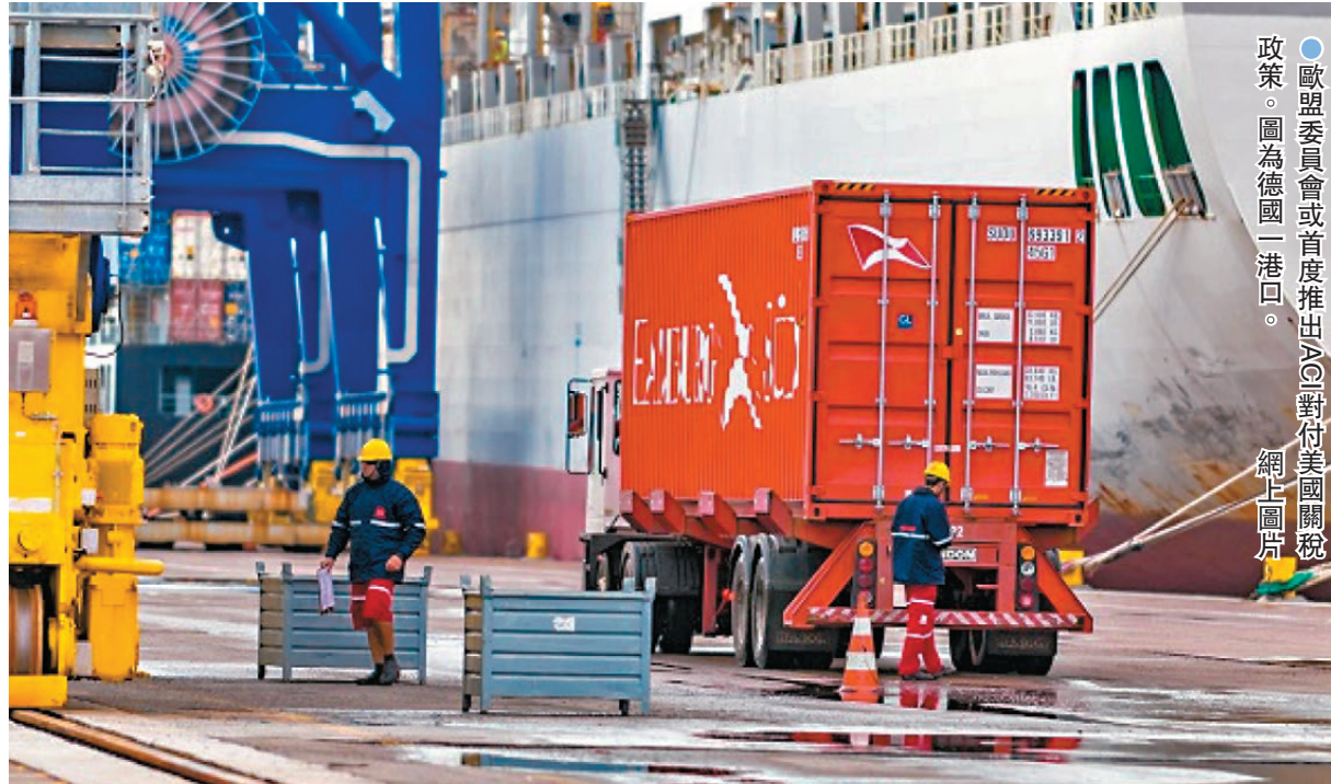
●歐盟委員會或首度推出ACI對付美國關稅政策。圖為德國一港口。