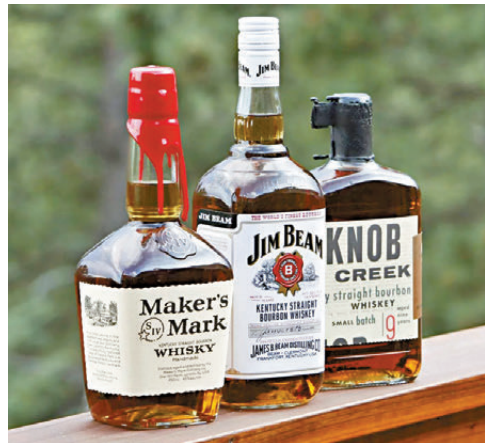
●三得利擬把美國威士忌專注在美境內銷售。

三得利控股行政總裁新浪剛史接受英國《金融時報》訪問時表示，由於特朗普的關稅威脅，以及包括歐洲在內主要市場的消費者情緒，該公司在制訂計劃時，會假設其美國品牌將「不太被接受」，「我們制訂了2025年的戰略和預算計劃，預計美國產品包括威士忌，將在