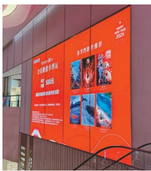
●春節檔影片推薦，應有一部你喜歡。

發出盈警，為龐大的投資額額，向公眾告急，希望戲院商能給予更大的支持，排得更好的播放場次。6套大片中票房順序排名第3至5位有《封神第二部：戰火西岐》、《射雕英雄傳：俠之大者》和《熊出沒·重啟未來》。 于冬加林超賢這個組合，打從《紅海行動》到《長津湖》系列，過去同樣是信心的保證，但據說拍這套《蛟龍行動》的投資高達10億元，賺回成本必定遇上很大的難題。到底是這個春節檔期對手太強，分薄了原有的利潤，還是觀眾的口味有了改變？《哪吒2》上映前已被視為熱門，但沒想到以7日票房計算連《唐探1900》也只能在後面食塵，難怪氹仔沒蛟龍，《封神第二部》嚴格來說也是續集。至於《射雕英雄傳》自然是希望乘去年是查大俠周年紀念，推出的武俠小說電影，票房7天跑了大概收6億元。 綜觀2025年度春節票房已衝破100億元人民幣。創華人電影市場累積票房破北美票房的成績。排第二的《唐探1900》也創同系列電影破100億元人民幣的紀錄，實在可喜可賀。