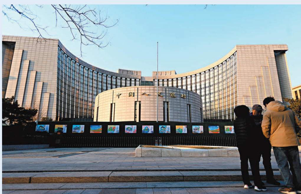
●中國人民銀行行長潘功勝上月宣布了六項深化香港與內地金融合作的新舉措，措施之一正是推出金管局人民幣貿易融資流動資金安排。圖為中國人民銀行。資料圖片