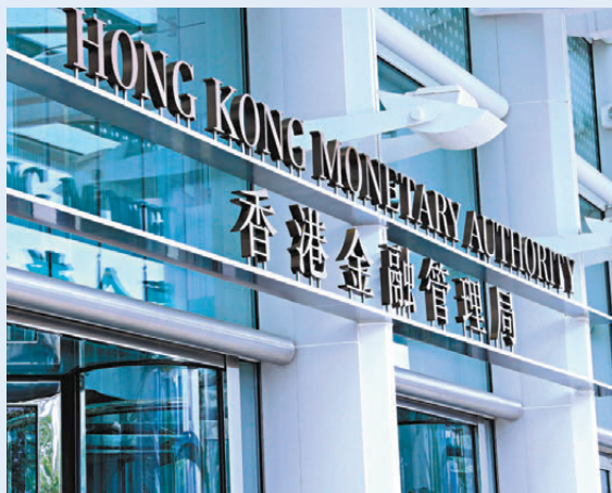
●金管局公布將運用與中國人民銀行的貨幣互換協議，推出總額為1,000億元人民幣的貿易融資安排。圖為金管局。資料圖片