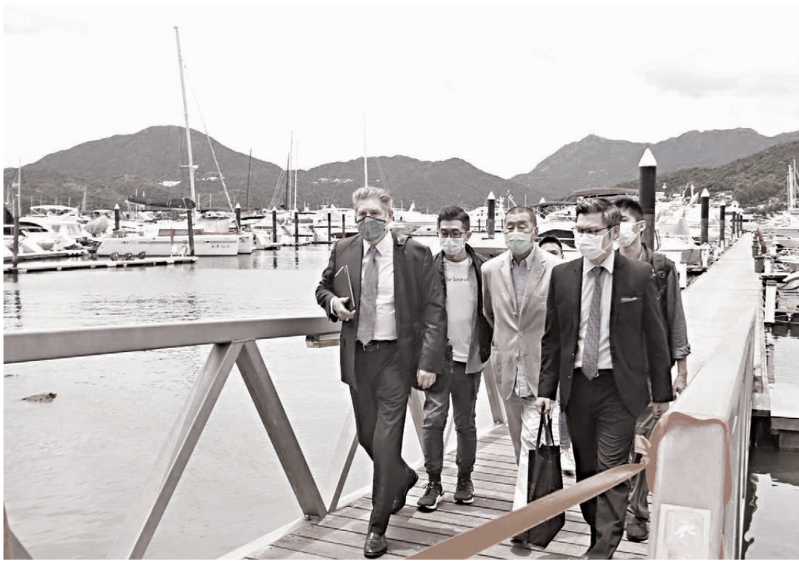
黎智英2020年被捕後，被警方押往其於西貢白沙灣的遊艇搜證。

肥黎受審 壹傳媒創辦人黎智英與《蘋果日報》三間相關公司被控串謀勾結外力危害國家安全案昨日續審。針對黎智英對撐黑暴的反華組織「對華政策跨國議會聯盟（Inter-Parliamentary Alliance on China, 簡稱IPAC）」的認知，控方在庭上引述陳梓華證供指出，黎在2020年6月16日會面時，問陳為何不參與IPAC，反映黎當時覺得IPAC相當重要，「一定要有呢啲國際支持先會有用。」控方指，黎智英早前先後三次在庭上供稱，之前未曾聽聞也不知道IPAC的存在，是在庭上才首次聽聞IPAC，質疑他是在向法庭說謊。法官亦質疑IPAC創辦人裴倫德（Luke de Pulford）要求黎智英刊登的報道明顯是關於IPAC，黎智英最後承認利用《蘋果日報》幫IPAC宣傳。 ●香港文匯報記者 葛婷