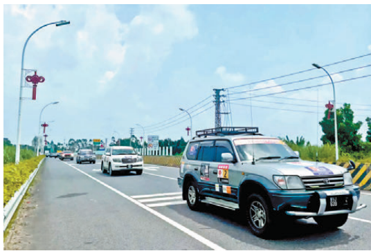
●馬來西亞陳嘉庚基金車隊重走滇緬公路。

車隊結束在昆明的活動後又前往貴州、重慶和湖南衡陽，並來到陳嘉庚先生的故鄉福建廈門參觀，緬懷陳嘉庚先生忠公、誠毅、勤儉、創新的