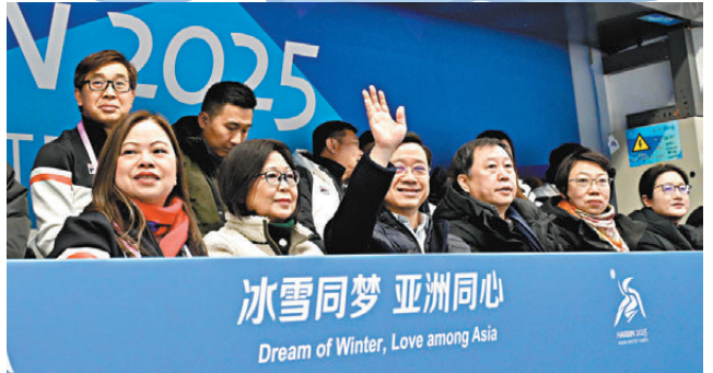
● 李家超(前排左三)觀看冰壺項目賽事，並為香港運動員打氣。

香港文匯報訊 行政長官李家超昨日(2月9日)在哈爾濱與國家體育總局局長高志丹會面，並觀看2025年第九屆亞洲冬季運動會(亞冬會)賽事，為參賽的香港運動員打氣。