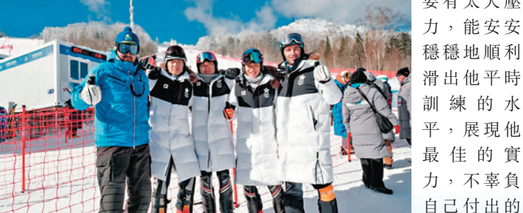
● 港隊成員合照。