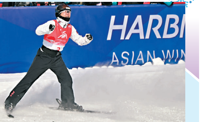
● 徐夢桃在賽後慶祝。