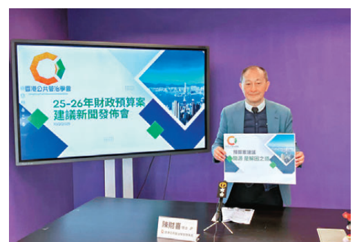
●香港公共管治學會建議今個財政年度凍結公務員編制及高級官員薪酬。

數據作分析，不宜直接取消計劃。他提出開源方法，建議本港參考歐盟做法，向批發商徵收塑料包裝稅，料每年可獲約8億至10億稅額；又建議每支煙草稅調高5毫，重新引進遺產稅，以及增加博彩稅，尤其足球博彩稅。