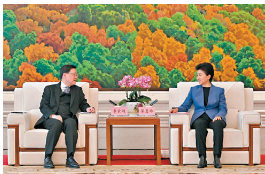
●李家超（左）與梁惠玲（右）會面。

人交流，了解他們在當地的生活和個人發展情況。李家超指，當地的港人港企是聯繫兩地的重要橋樑，鼓勵他們多向當地企業介紹香港的最新發展，說好香港故事。