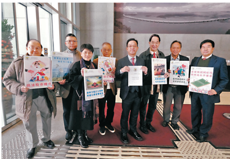
●新界鄉議局昨日與陳茂波會面，就新一份財政預算案提交建議書，涵蓋8個範疇共19項建議。