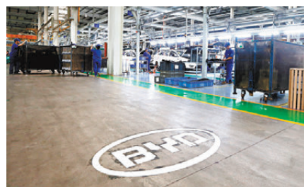
●瑞銀認為購買者和投資者可能會進一步關注汽車智能化趨勢。

銀認為汽車購買者和投資者可能會進一步關注汽車智能化趨勢。比亞迪預計將把這些功能下放到經濟型車型上。瑞銀還認為傳統汽車製造商可能會在未來幾個月宣布與AI企業進行更多合作。對於投資者來說，瑞銀預計具有技術背景的造車新勢力將是重點關注目標，因其在AI開發和應用以及製造流程等方面有所布局，並預計未來的財報電話會上會大量提及AI。